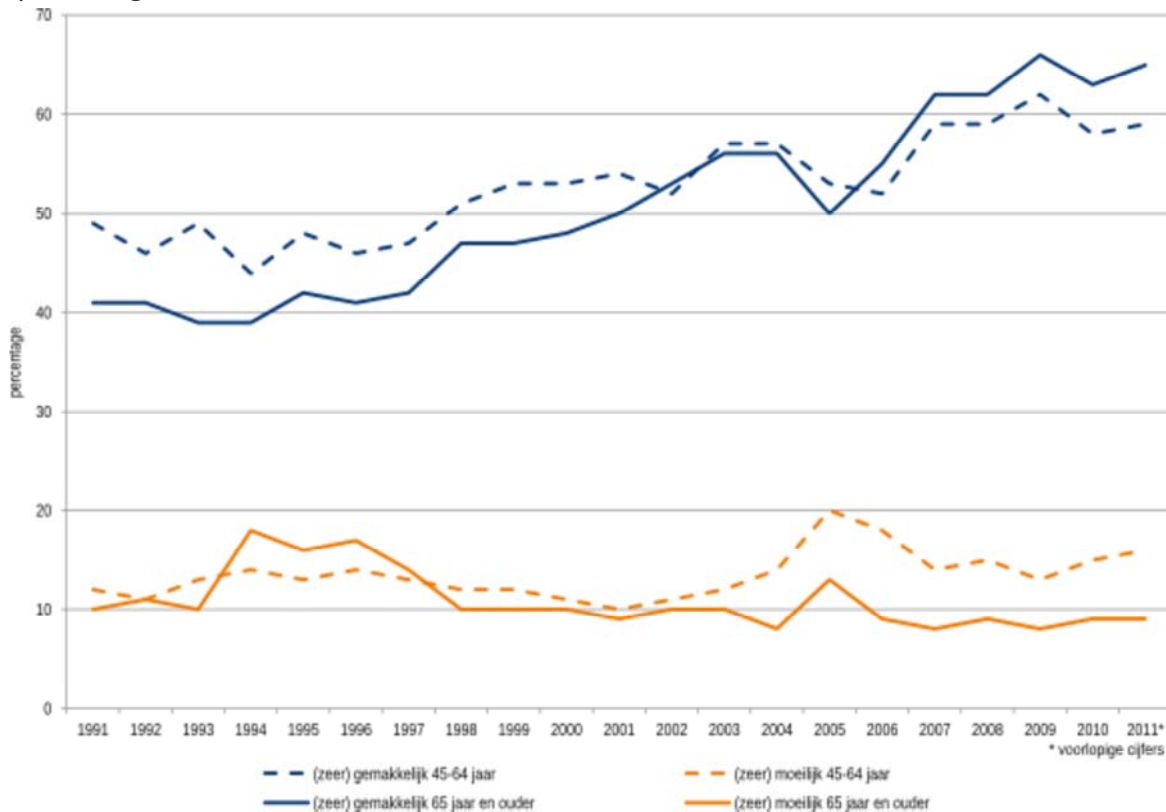
Figuur 1: Mate waarin oudere leeftijdsgroepen rond kunnen komen van hun inkomen, 1991-2011 (percentages)