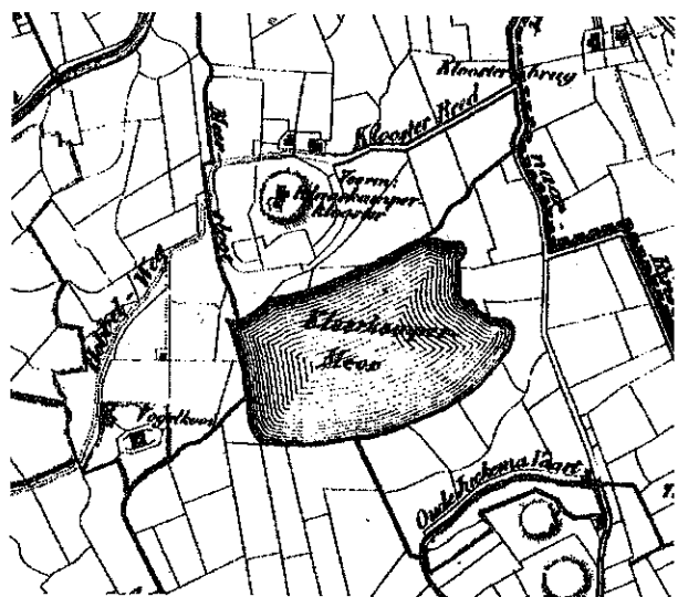
Fragment kaart Dantumadeel Eekhoff, 1847