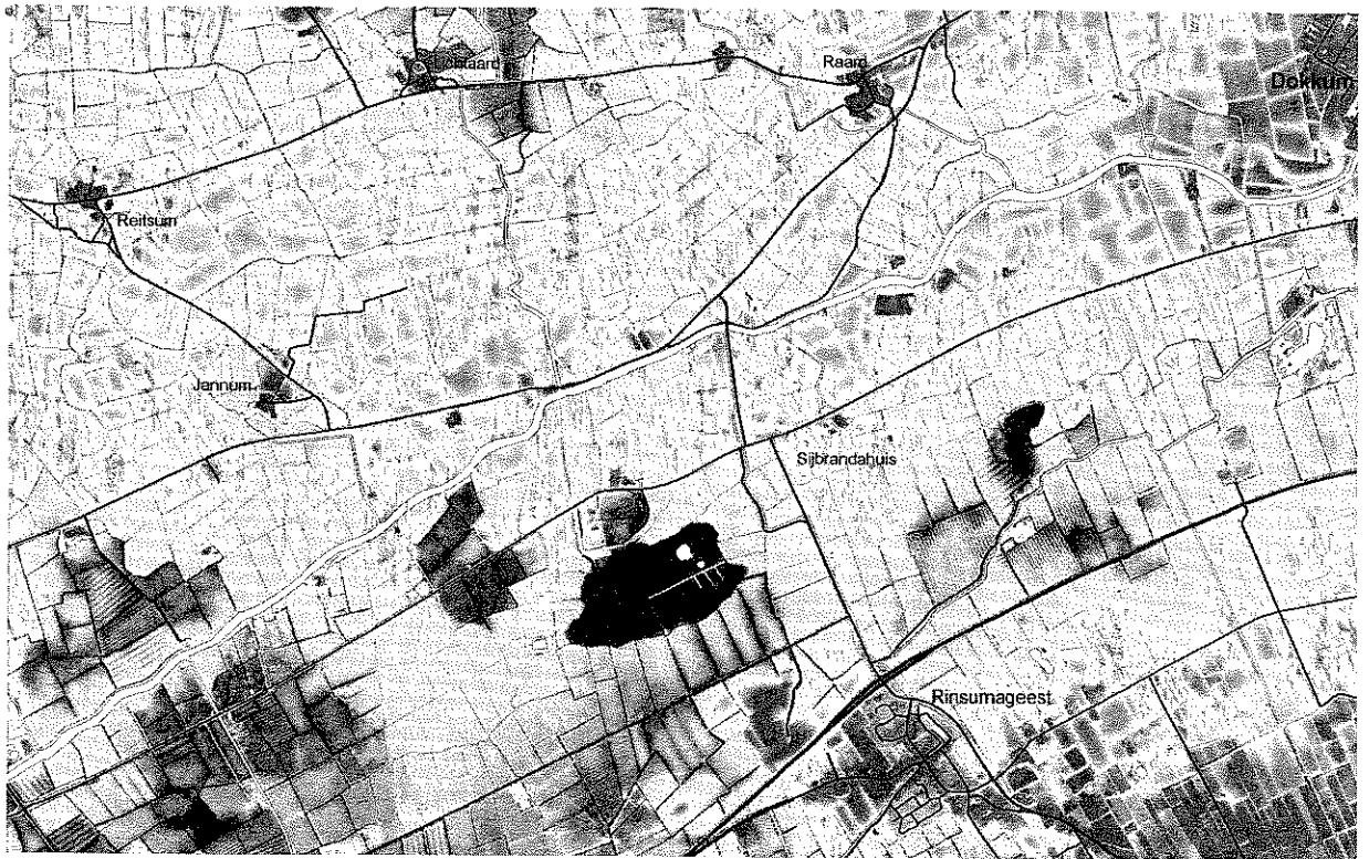
Klaarkamp en omgeving op de hoogtekaart uit het Actueel Hoogtebestand Nederland (AHN)

aan de westkant, omdat het zo min mogelijk te verstoren religieuze werk van de kloosterlingen aan de oostzijde, in het koor van de kerk, werd uitgevoerd. In het geval van Klaarkamp zal dat ook zo geweest zijn, getuige onder meer de naam Poortfenne voor juist het noordwestelijke singelperceel van dit complex. Hoe die dijk gelopen heeft - naar Rinsumageest in het zuiden en naar de Ee in het noorden? - valt slechts te raden. Hoe dan ook, bij de voornaamste poort kunnen we een poorthuis verwachten - waar brood en andere spijzen aan de armen uitgedeeld werden -, een bakkerij, een brouwerij en een aantal gastenverblijven zoals bijvoorbeeld een vrouwenhuis. Van dat vrouwenhuis in Klaarkamp is expliciet sprake in een provenierscontract uit 1550. Het is mogelijk dat op de westkant van het eigenlijke kloosterterrein ook enkele agrarische bedrijfsgebouwen hebben gestaan. Het ligt echter meer voor de hand dat die van het geestelijke kloosterbedrijf gescheiden en apart bijeengebracht waren op de afzonderlijk omgrachte noordelijke structuur. Het is immers opvallend dat meteen na de opheffing van het klooster het zogenoemde corpus-goed - dat is dat land dat nog door de monniken in eigen beheer werd gehouden - in drie, vier delen werd verdeeld, waarvan er twee gepacht werden door huurders die gebouwen betrokken aan de noordkant van het klooster. Anders gezegd, de twee boerderijen die er nu nog zijn en waarvan