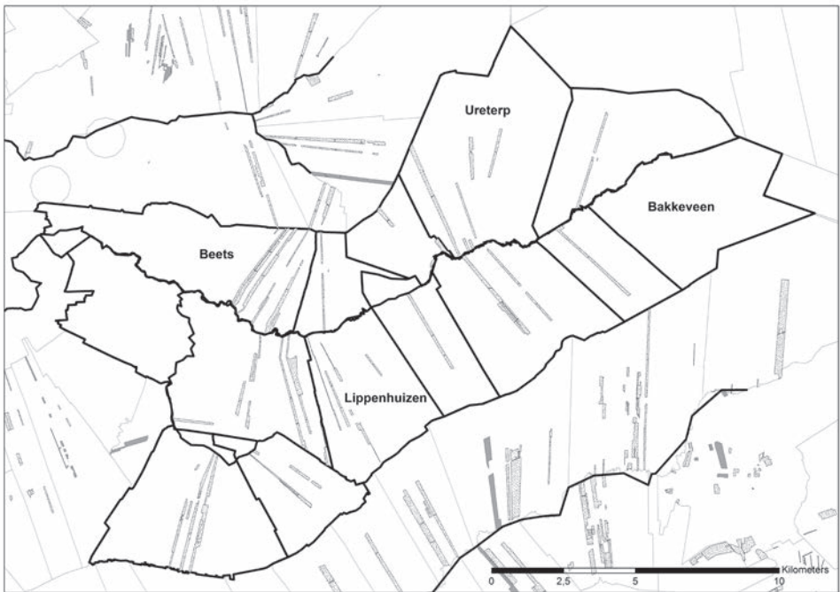
Het beneficiale land van de Opsterlandse parochies

Niet alleen landschappelijk is het verschil groot, ook wat betreft het kerken- en pastoorland is het beeld in Opsterland geheel anders dan in Ferwerd: de beneficiale goederen vormen hier geen grote aaneengesloten blokken maar bestaan steeds uit smalle strookjes land ter grootte van een bescheiden boerderijtje. De opbrengst was dan ook maar een fractie van die in Ferwerd. In Ferwerd resideerden drie van rijke beneficies voorziene priesters, in het merendeel van de dorpen in Opsterland was er alleen een pastoor en die kreeg in 1511 in de meeste dorpen niet meer dan fl. 3 voor zijn pastorieland. 31 Dat is dus één tiende deel van hetgeen de Ferwerder pastoor ontving.