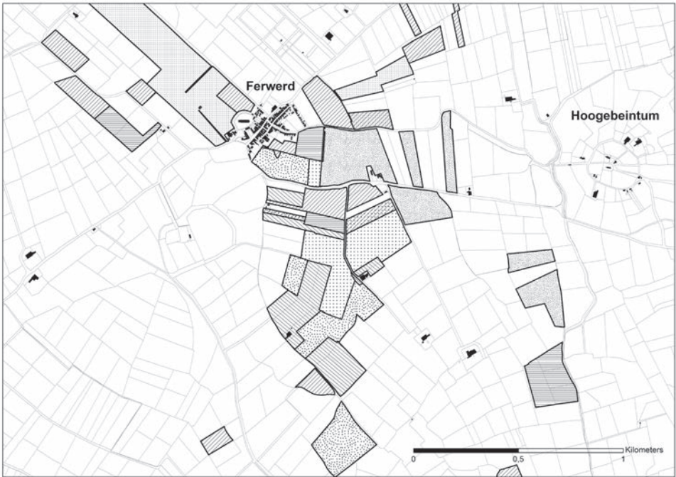
Het domein rond Ferwerd. Gearceerd: het land van de beneficia van de kerk. Gepunt: goederen van de abdij van Foswerd

‘Monnikhuis’ ten noorden van de kerk, de sate ‘bij de Molen’ en ‘Bama-sate’. Deze Foswerder goederen vormden met de beneficiale goederen van de kerk en de dorpskom rond de kerk een aaneengesloten complex. Het geheel lag op en ter weerszijden van de vruchtbare zavelige oeverwal, waarover in de middeleeuwen de Oude Zeedijk was gelegd. De kerkterp en een groot blok Foswerder land, namelijk het Monnikhuis, lagen dus buitendijks. Dit wil nog niet zeggen dat het geen oud cultuurland was. Ook bij andere oude kerken langs de kust, zoals in Leeuwarden, Holwerd en Usquert treffen we een ligging van land van de kerk aan of buiten de dijk aan. De middeleeuwse Fries kon leven met de periodieke overstroming van de door hem gebruikte landerijen. 20