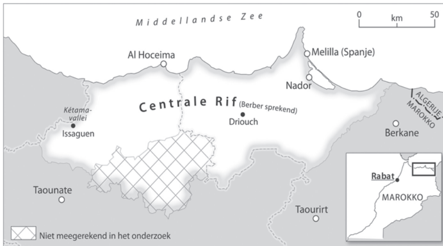
Figuur 2 Het Rifgebied

dige woonplaats. Om te achterhalen of er voor leeftijd sprake is van een niet-lineair verband, is naast deze variabele ook het kwadraat ervan in de analyse meegenomen. Voor de positie in het huishouden is onderscheid gemaakt tussen kinderen en overige huishoudensleden die deel uitmaken van een tweeouderhuishouden (referentiegroep) of van een eenouderhuishouden. Verder worden onderscheiden: alleenstaanden, partners in (echt)paren zonder kinderen en partners in (echt)paren met kinderen. Er is nog een gemêleerde categorie 'overig', die bestaat uit alleenstaande ouders, personen in instellingen en tehuizen, en enkele andere restgroepen. Wat de mate van stedelijkheid betreft, zijn de volgende categorieën onderscheiden: zeer sterk stedelijk, sterk stedelijk, matig stedelijk en weinig tot niet stedelijk (de referentiegroep).