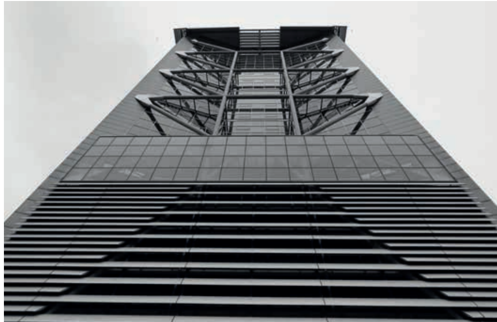
VNO-NCW Malietoren in Den Haag

De weerstand tegen de stijging van de AOW-leeftijd heeft alles te maken met de zorgen van werkgevers over het langer in dienst houden van oudere werknemers. Zij zijn vooral bezorgd over de beperkte inzetbaarheid van oudere werk-