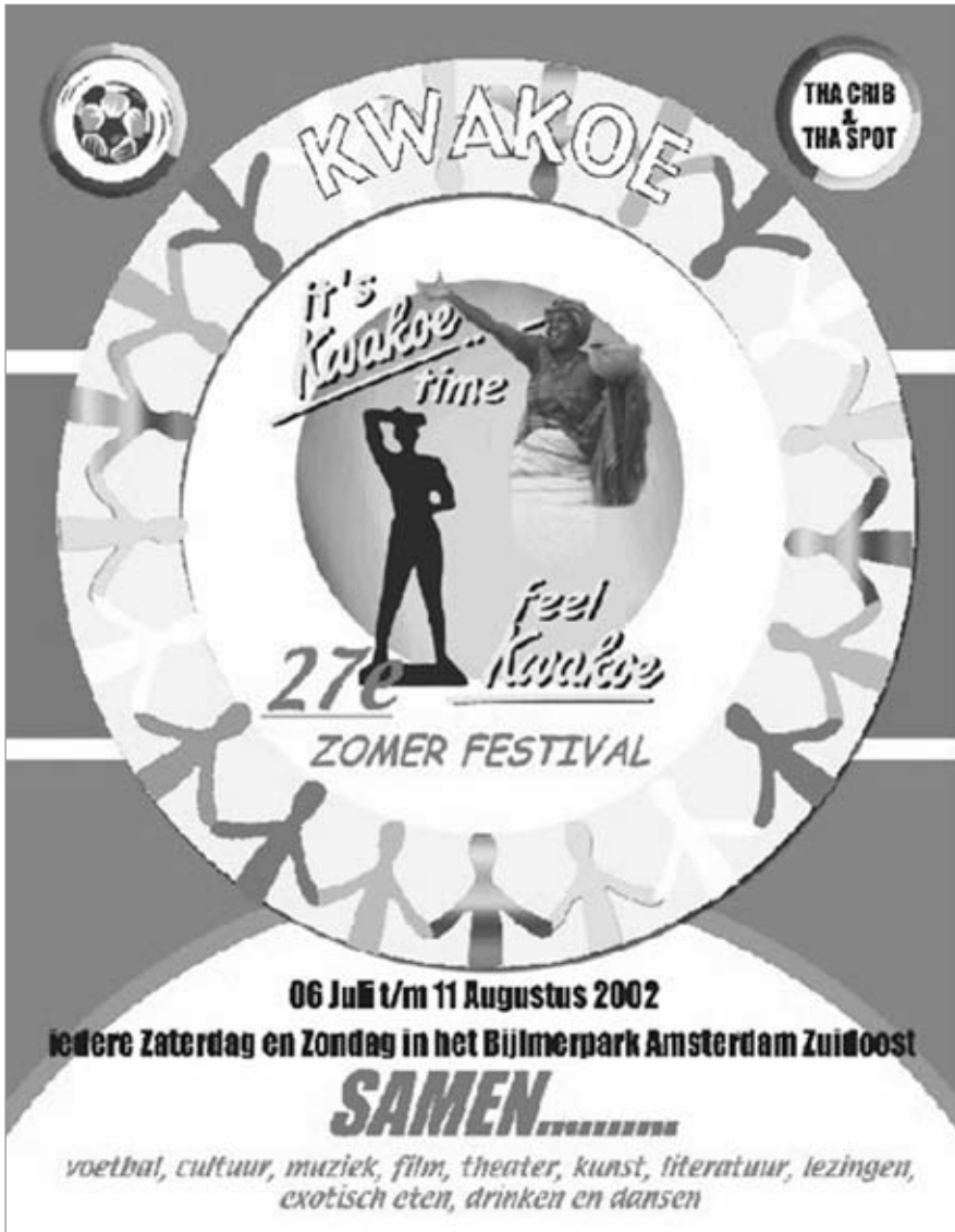
Afbeelding 2: Poster Kwakoe Zomer Festival 2002

Multiculturalisme en de Surinaamse cultuur gaan hand in hand op Kwakoe. Binnen de kring van multicultureel gekleurde poppetjes bevinden zich de symbolische figuur Kwakoe en miss Kwakoe (afgebeeld als de creools-Surinaamse oervrouw), twee symbolen van de creools-Surinaamse cultuur.