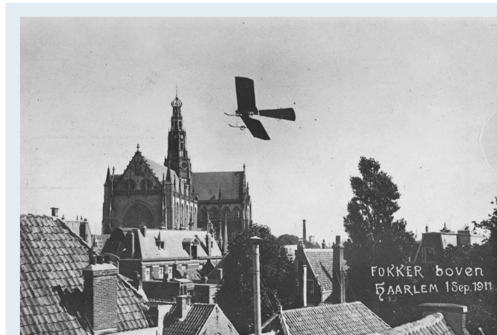
Met zijn Spin vliegt hij rond de Grote Kerk.