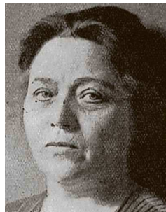
Agnes de Vries-Bruins (1874-1957), SDAP (Social-Democratische Arbeiderspartij)