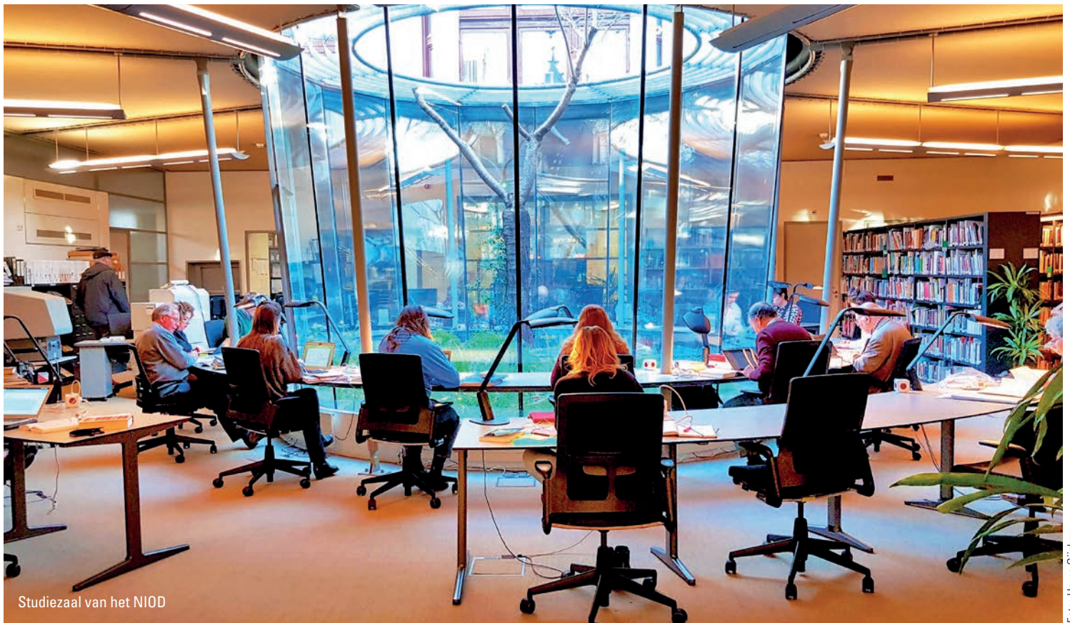
Studiezaal van het NIOD