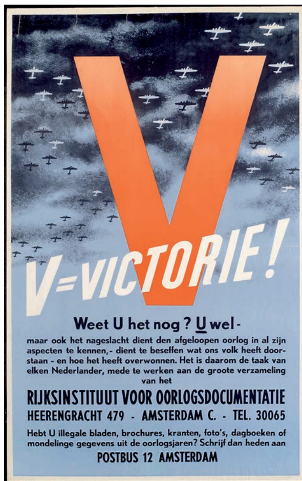
Affiche RIOD NIOD - Beeldbank WO2

data gepubliceerd. NOB gebruikt de WO2-thesaurus om geautomatiseerd de tien miljoen bronnen uit honderden oorlogscollecties met elkaar te verbinden. Juist in een digitale omgeving blijkt zo'n old skool instrument als een thesaurus weer van groot belang.