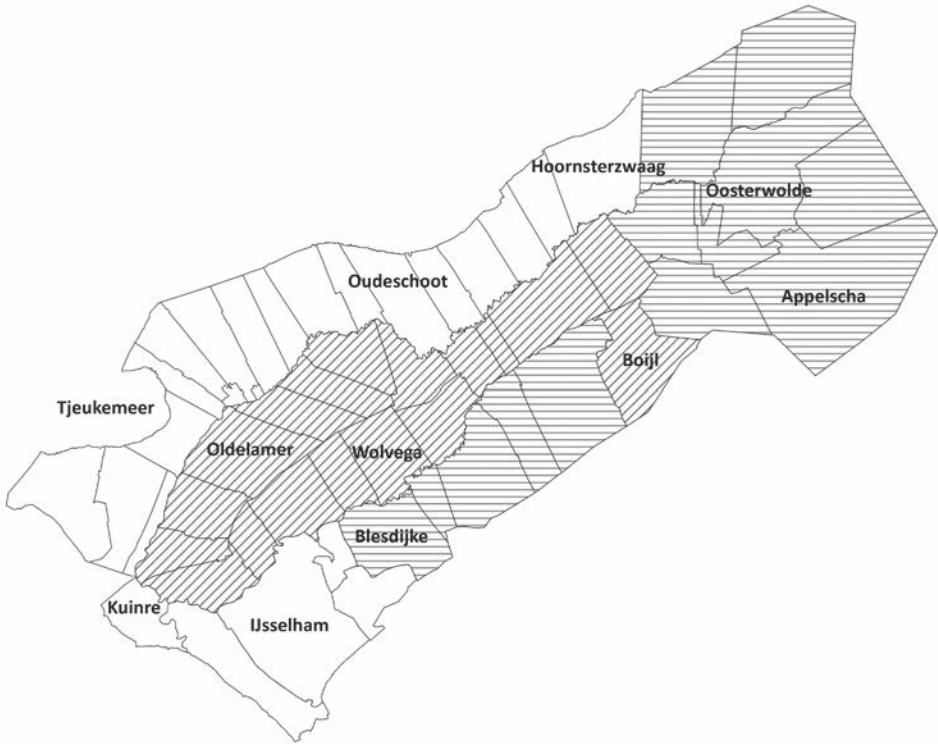
Afbeelding 1. De zeventien parochies die in 1320 een overeenkomst aangaan met de bisschop van Utrecht zijn allemaal, op Boijl na, gelegen tussen de Linde en Kuinder (schuin gearceerd). De parochie Boijl past niet goed binnen het geografische patroon. De parochies die zich in 1328 aansluiten bij de 'Frisones van Stellingwarf' zijn horizontaal gearceerd.

te willen voldoen aan de in 1313 gestelde eisen (afb. 1). 67 Behalve Boijl zijn deze parochies allen ten noorden van de Linde gelegen. Van deze zeventien parochies hadden alleen de kerkvoogden en parochiepriesters van Boijl, Sonnega, Wolvega en Oldeholtgade in 1543 bezit in de broeklanden. Acht jaar later sloten twaalf parochies zich aan bij de Frisones van Stellingwarf . 68 In een uitgebreide beschouwing beargumenteert Vries dat het hier zeven Ooststellingwerfse en vijf Weststellingwerfse dorpen betrof (afb. 1). 69 Vijf van deze parochies (Noordwolde, Vinkega, Steggerda, Peperga en Blesdijke) beschikten in 1543 over hooiland in het Friesche Broek (tabel 3). De vraag is waarom zij niet in de oorkonde uit 1320 genoemd worden. Het is immers onwaarschijnlijk dat ze hun hooilandbezittingen in de Kop van