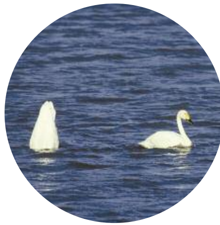
Foto 2. Kleine zwanen in het Lauwersmeer. De linker grondelt naar knolletjes; de rechter trappelt een kuil.

Kleine zwanen kunnen in de herfst enorme hoeveelheden fonteinkruidknollen opeten, tot wel 80% van het aanbod (Nolet et al., 2006). Dit heeft echter weinig gevolgen voor de hoeveelheid knolletjes een jaar later, omdat dit verlies grotendeels wordt gecompenseerd door hergroei in voorjaar en zomer (Nolet, 2004; Hidding et al., 2009a). In een enclosure studie van het Nederlands Instituut voor Ecologie (NIOO-KNAW) waarin we vier jaar lang proefvakken afschermden tegen Kleine zwanen in de herfst (foto 3) bleek dat de plantenbiomassa binnen deze vakken in de zomer weinig verschilde van vakken waar zwanen wel gevoerageerd hadden. Het geheim voor deze sterke hergroei is dat foerageren op fonteinkruidknolletjes een intensieve bezigheid is; arbeid loont alleen als het voldoende energie oplevert. Om het voedsel te bemachtigen trappelen de zwanen en maken zo kuilen in de waterbodem. Hieruit pikken ze de knolletjes al grondelend op. De knollen zitten vaak vrij diep, tot zo'n 30 cm onder het bodemoppervlak. Deze diepe plaatsing beschermt de knolletjes zowel tegen eventuele fluctuerende waterstanden als tegen grondelende zwanen, die zodoende de diepere knolletjes moeilijker kunnen bereiken (Santamaría & Rodríguez-Girónes, 2002;