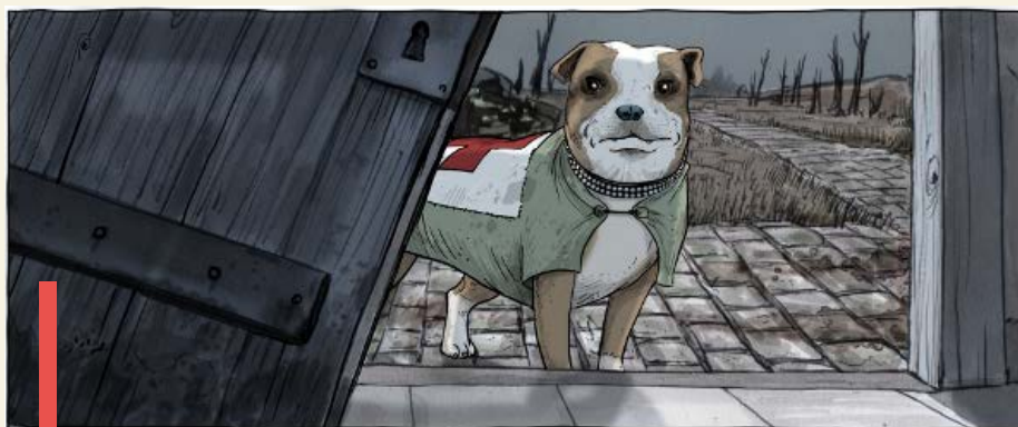
De hond Stubby