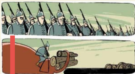
Een scene uit het boek met olifant Jenny

Dat mag een vertederende indruk wekken, al was het maar omdat de schaarse oorlogsdieren waarover wij vandaag de dag nog geïnformeerd zijn vooral als mascotte golden. De meeste van de zestien miljoen dieren die werden ingezet tussen 1914 en 1918 verrichten echter vooral militaire taken. Zij kregen niet standaard een naam. Hun bestaan is amper vastgelegd en pas vrij recent hebben enkele monumenten in Angelsaksische landen en culturele producties als War Horse en Cher Ami de aandacht gevestigd op hun aanwezigheid.