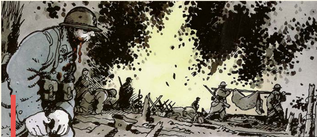
Afbeelding uit het boek De Grote Slachting 1914-1919

In dit stripverhaal zijn bommen en granaten geen abstracties maar concrete wapens die op grote schaal menselijke ellende veroorzaken. Afgerukte ledematen worden zonder opsmuk getoond evenals de lijken die door maden en vliegen worden opgegeten. Het grauwe en sombere bestaan in en achter de loopgraven schetst Tardi vooral in grijstinten, al begint hij zijn verhaal veel kleurrijker. Nadat de kleur verdwijnt uit enkele losse kaders domineren vervolgens de grauwe maar daardoor niet minder aansprekende bladzijden. Zijn tekenstijl past daar uitstekend bij en werkt in alle somberheid zeer krachtig. Pas bij een parade ter gelegenheid van de wapenstilstand keert kleur eind 1918 uitbundig doch kortstondig terug – maar het is moeilijk om daar dan nog vreugde of opluchting bij te ervaren.