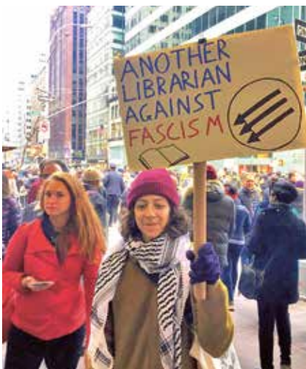
Bibliothecaris tijdens de Women's March op 21 januari 2017

Amerika telt zo'n 120.000 openbare, wetenschappelijke, speciale en schoolbibliotheken. Een groot deel van de bibliothecarissen aldaar komt in verzet tegen Trump. Een aantal van zijn maatregelen druisst namelijk in tegen het wezenlijke van bibliotheken: toegang bieden tot alle informatie voor iedereen.