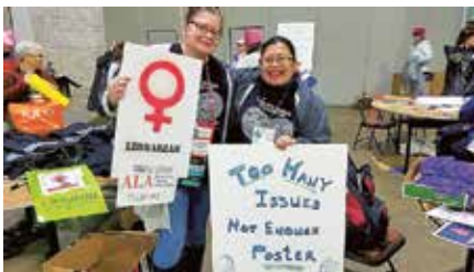
Bibliothecarissen bereiden zich voor op de Women's March op 21 januari 2017