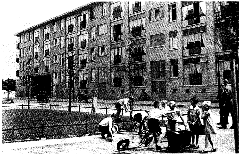
De straat als publieke speelkamer.

De uitnodiging die hij kreeg om de vijfde Documenta in Kassel in 1972 voor te bereiden gooide evenwel roet in zijn bijdrage aan de Eindhovense expositie. Documenta V zou uitgroeien tot een legendarische presentatie waarin veel van het gedachtegoed dat ook in Eindhoven werd gepresenteerd, herkenbaar was. De tentoonstelling in het Van Abbemuseum is, ten onrechte, evenwel nagenoeg geheel vergeten. Het museum is immers een andere, meer esthetisch op kunstwerken georiënteerde, koers ingeslagen.