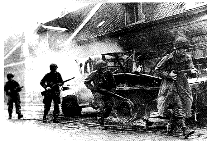
De straat: decor voor oorlogsgeweld én feestvreugde. Links: Amerikaanse soldaten van de 101ste Airborne-divisie rukken tijdens de operatie Market Garden in 1944 op door de Hoogstraat in Veghel. Rechts: Een uitbundig versierde Visserstraat in Steenberg ter gelegenheid van koningin Wilhelmina op 31 augustus 1898.

Het Brabants Fotoarchief heeft in het kader van het project 'Brabantse fotografie van de twintigste eeuw', in samenwerking met de Brabant-Collectie en de stichting BRG, onderzoek laten verrichten naar de geschiedenis van de prentbriefkaartfotografie. Het betreft een studie van Pierre van de Pol naar de Bredase fotograaf Herman de Ruiter en een onderzoek van Mariel Peñaloza Moreno die leven en werk van Jan Bijnen te Waalre als uitgangspunt genomen heeft. Dit laatste project zal aan de Universiteit van Amsterdam verdedigd worden als proefschrift. Het boek over Herman de Ruiter verschijnt dit jaar bij het Noordbrabants Genootschap.