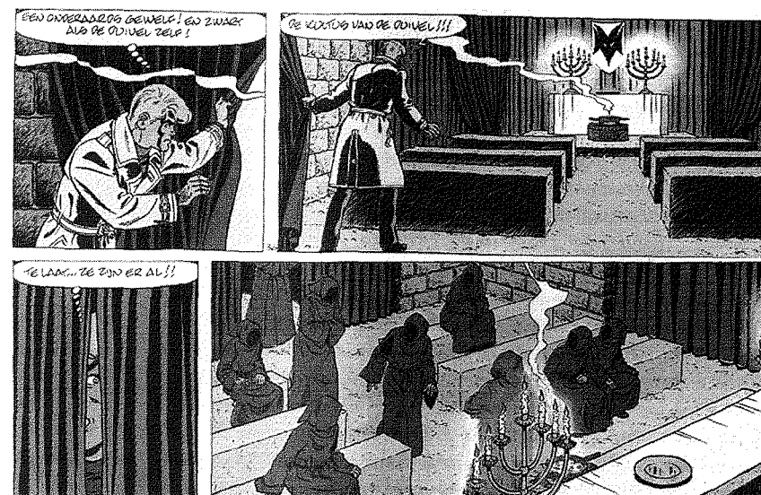
Geromantiseerde stripvoorstelling van een satanische cult (Fragmenten, in: Tiber; A.P. Duchateau, Rik Ringers. De duivelse tweeling , nr. 47 (Brussel 2002), p. 38, p. 40).

Bij deze rituelen die ik zag, waarbij men in trance verkeerde, deinsden de sadisten, masochisten en andere mannen en vrouwen nergens voor terug. Ze misbruikten vele kinderen seksueel en ritueel, zij martelden, verkrachtten vaak met medewerking en toestemming van mijn ouders, die ook in die wereld leefden.”