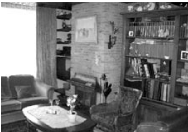
De zithoek in de woning van een respondent

Gezelligheid is iets ongreepbaars, dat voor veel Nederlanders van groot belang lijkt te zijn als het om de inrichting van het dagelijks leven gaat. Het is een notie die verwijst naar intimiteit en informaliteit. We stellen ons nu de vraag in hoeverre men bij de concrete invulling van de notie gezelligheid uitingen van religiositeit en familiaal bewustzijn vindt passen. In beschrijvingen van het Nederlandse interieur nemen deze twee zaken geen prominente rol in. Betekent dit nu ook dat ze ontbreken in veel interieurs? De enquêteresultaten laten wat dit betreft geen duidelijk beeld zien. Drie van de vijf respondenten heeft religieuze voorwerpen in huis, en bij twee van de vijf staan ze op een zichtbare plek. Vaak blijken ze uitsluitend een decoratieve functie te hebben. Eén van de respondenten zegt bijvoorbeeld: “We hebben een plaatje van [het klooster van] Chevetogne, maar we hechten daar geen religieuze betekenis aan” . In veel woonkamers staan voorwerpen of schilderijen van verschillende religies. Het neerzetten of ophangen van een voorwerp met een christelijke connotatie sluit de aanwezigheid, in dezelfde ruimte, van een voorwerp dat symbolisch is voor een andere religie (bv. een boeddha-beeld) voor de sier niet uit. Zo verklaart een respondent die in zijn woonkamer een boeddha-beeld naast een Mariabeeld heeft staan: “Ik vind het mooi en daarnaast is het boeddhisme de meest pacifistische godsdienst die er bestaat” .