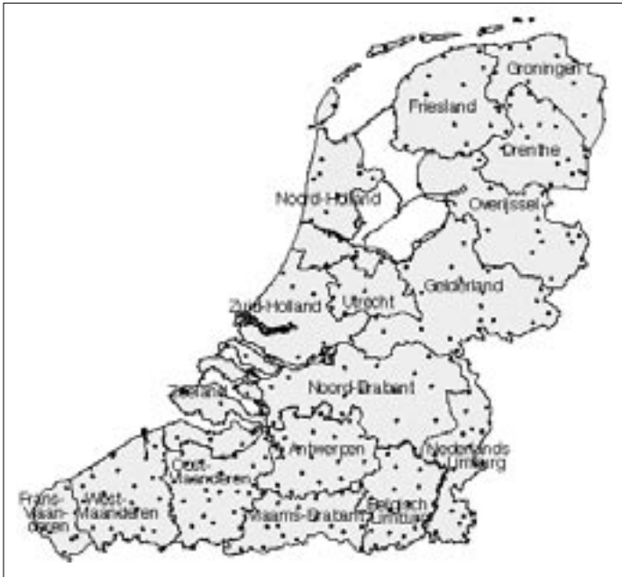
Afbeelding 1: De onderzochte dialecten in het Nederlandse taalgebied