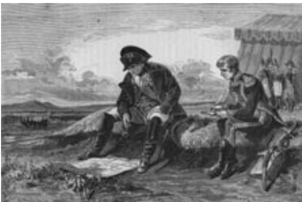
Napoleon peinst op de namen van zijn onderdanen

Het patroniemensysteem, dat met de invoering van de burgerlijke stand in feite werd opgeheven, was omstreeks 1800 in den lande nog alom een vertrouwd gebruik. In enigszins afgelegen en dunbevolkte streken volstond het patroniem zelfs, eventueel in combinatie met de naam van de boerderij die men bewoonde en die als achternaam fungeerde. Maar aangezien we een dergelijk stelsel nu alleen nog kennen uit Russische romans (bijvoorbeeld Aleksej Fjodorowitsj Karamazow, zoon van Fjodor Pawlowitsj Karamazov uit 'De gebroeders Karamazow' van Dostojewski), vereist het enige toelichting. Een patroniem is een achternaam die afgeleid is van de voornaam van de vader. Die achternaam was generatiegebonden. In Friesland heette iemand bijvoorbeeld Jelle Douwes., dat wil zeggen: Jelle, de zoon van Douwe. De zonen van Jelle heetten op hun beurt Douwe Jellesz. en Pieter Jellesz. en zijn dochter heette Grietje Jellesdogter. Zoals gezegd was deze benaming voldoende in kleine gemeenschappen, maar het patroniem maakte ook wel deel uit van een driedig namensysteem en het fungeerde dan als 'tussenaam', bijvoorbeeld in de combinatie Douwe Jellesz. Timmerman. Ook het patroniem zelf kon naar de derde positie doorschuiven en zo een familienaam