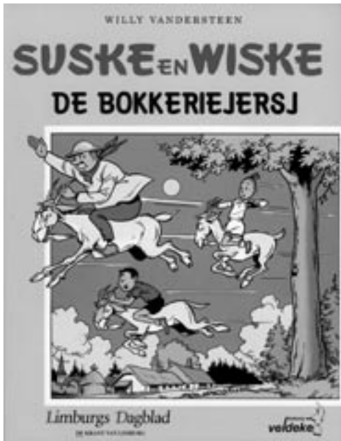
Suske en Wiske in het Limburgs: tante Sidonia spreekt Heerlens

Het klinkt aannemelijk dat je maar één taal goed kan leren en dat het onverstandig is om een klein kind met twee talen in aanraking te laten komen. Onlangs nog stond er een betoog met die strekking in het Algemeen Dagblad (Weggemens 2006). De term moedertaal, die we zo makkelijk hanteren, is dan ook een metafoor voor dit denkbeeld. Het impliceert dat elk individu maar één moedertaal heeft, net zoals elk individu maar één biologische moeder kan hebben. Toch heeft taalkundig onderzoek de laatste veertig jaar uitgewezen dat deze aanname fout is. Elk kind kan onder bepaalde condities meer dan één taal of dialect goed verwerven. Wat zijn die condities?