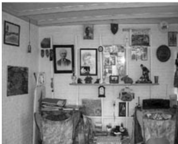
Voor de bewoonster van het huis waar deze foto is genomen, staat gezelligheid los van de inrichting

omhoog, en vitrages hoeven van haar ook niet zo nodig: “Ik wil als het even niet hoeft geen vitrages, want dat vind ik te vol. Ik wil licht en ruimte.” Een ander zegt de gordijnen weleens voor de warmte dicht te doen, ‘maar nooit tegen de inkijk’ . En een derde informant licht toe: “De gordijnen zijn voor de sier en om het geluid te absorberen” .