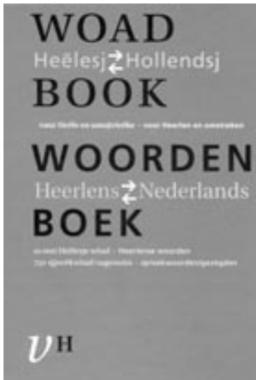
Omslag van het Heerlens dialect-Nederlands woordenboek

maar het lidwoord de; het komt nog helemaal niet voor: