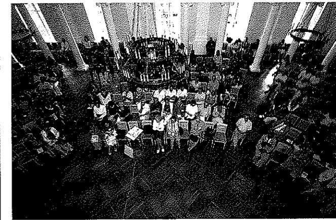
Publiek plenaire lezing

name over kettingbrieven per e-mail, terroristengrappen per sms en internet-dating. Ze benadrukte dat deze vormen van verhalen vertellen dezelfde functies vervullen als in de orale cultuur, en dat de e-folklore evengoed zicht biedt op collectieve angsten, vooroordelen en wensdromen. Mariann Domokos (Boedapest) hield een voordracht over Folklore and mobile communication: sms and folklore text research . Ze benadrukte dat sms-taal nagenoeg geschreven spreektaal is, en dat folklore te vinden is in moppen, raadsels, kettingbrieven en gelegenhedsgroeten (met onder meer Pasen, kerst en nieuwjaar). Terry Gunnell (Reykjavik) presenteerde zijn in aanbouw zijnde internetdatabase van IJslandse sagen onder de titel Sagnagrunnur , terwijl Katrien van Effelterre (Leuven) een uitstekende presentatie verzorgde van de Vlaamse Volksverhalenbank.