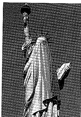
Het Amerikaanse vrijheidsbeeld met een burqa.

een nieuwe aanslag. Befaamd zijn de foto's van de rokende torens geworden, waarin mensen het gezicht van de duivel herkennen. Een enkeling heeft de foto van CNN nog nauwkeuriger geanalyseerd, en herkent een hele duivelsverschijning.