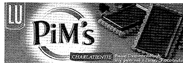
Het koekje Pim's met de beeltenis van Pim Fortuyn.

Dit is een mop die regelmatig gerecycled wordt, en waarin steeds een ander brutaal of arrogant persoon de punchline voor zijn rekening mag nemen. Dezelfde mop werd een jaar eerder nog verteld over voetbaltrainer Louis van Gaal. Op een zeker moment in de campagne sprak Pim Fortuyn de woorden: 'Nederland is vol' en 'Als het aan mij ligt, dan komt er geen moslim meer in.' En hij zei ook: 'De islam is een achterlijke cultuur.' De Volkskrant drukte de woorden met een zekere gretigheid af. De