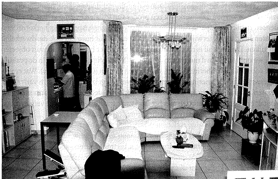
Woonkamer van een Hindostaans-Surinaamse familie, 19 oktober 2005.

Gaat men vervolgens over tot de aanschaf van eigen huisraad, dan is het dikwijls het land van vestiging waar men zich op richt, en niet het land van herkomst. Door te investeren in nieuw huisraad komt niet alleen de verwezenlijking van een droom dichterbij, het compenseert ook het mobiele element in het bestaan, en eventueel aanwezige gevoelens van onzekerheid over de toekomst. Objecten geven vaste voet aan de grond en vormen voor twijfelaars een bevestiging van de stap die ze hebben gezet. Door de aanschaf van nieuwe objecten neemt men een voorschot op de toekomst. Met de aanschaf van een nieuw interieur positioneert men zich als maatschappelijk geslaagd en in materieel opzicht in elk geval vermogend.