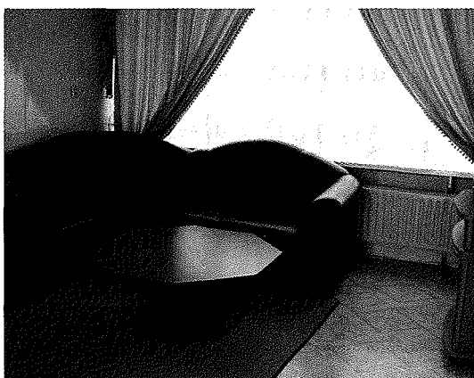
Woonkamer van een Marokkaans gezin uit Utrecht (foto: Meertens Instituut Amsterdam, 26 januari 2005)

Gaat men vervolgens over tot de aanschaf van eigen huisraad, dan is het dikwijls het land van vestiging waar men zich op richt, en niet het land van herkomst. Door te investeren in nieuw huisraad komt niet alleen de verwezenlijking van een droom dichterbij, het compenseert ook het mobiele element in het bestaan, en eventueel aanwezige gevoelens van onzekerheid over de toekomst. Objecten geven vaste voet aan de grond en vormen voor twijfelaars een bevestiging van de stap die ze hebben gezet. Door de aanschaf van nieuwe objecten neemt men een voorschot op de toekomst. Met de aanschaf van een nieuw interieur positioneert men zich als maatschappelijk geslaagd en in materieel opzicht in elk geval vermogend.