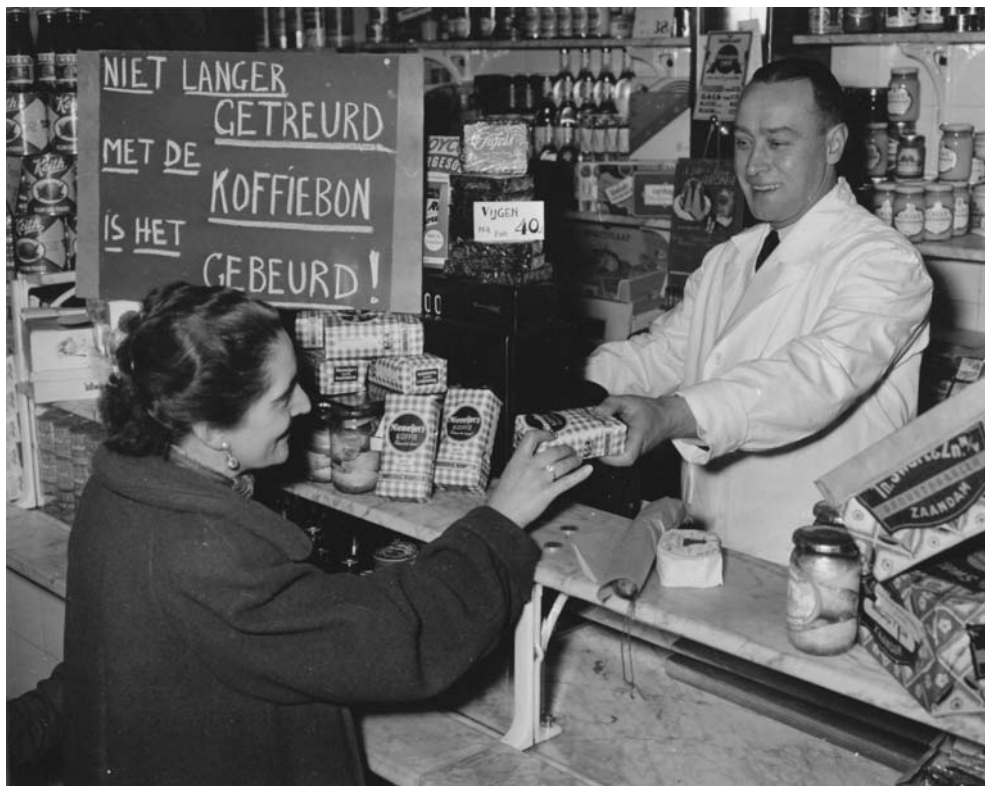
Kruidenier met bord op toonbank 'Niet langer getreurd, met de koffiebon is het gebeurd!' (Door de fotograaf geënsceeneerde foto). 13 januari 1951.

hierbij echter een belemmering. In de jaren zestig introduceerde de regering daarom een financiële regeling die moest leiden tot een sanering van de vele marginale bedrijven. Tegelijkertijd voerde de Nederlandse overheid een beleid om levensvatbare bedrijven in het мкв te ondersteunen met garanties en leningen. 27