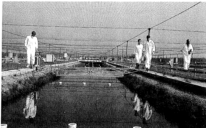
Figuur 1. In de proefsloten te Renkum van het onderzoeksinstituut Alterra bestudeert men onder andere de effecten van gewasbeschermingsmiddelen op levensgemeenschappen in stilstaand, ondiep zoetwater.

lenwet. Daarin is vastgelegd dat alleen middelen op de markt gebracht mogen worden die, bij gebruik volgens voorschrift, voldoende werkzaam zijn en geen onaanvaardbare schade toebrengen aan het gewas, de mens, planten en dieren (behalve de doelwitorganismen) en de kwaliteit van water en bodem. Voor gewasbeschermingsmiddelen zijn de milieueisen nader uitgewerkt in het Besluit milieutoelatingseisen bestrijdingsmiddelen. De Nederlandse regelgeving is verregaand aangepast aan de richtlijnen van de Europese Unie op dat gebied, te weten de Gewasbeschermingsrichtlijn en de zogenaamde Uniforme Beginselen.