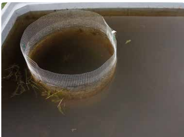
Links: proefopzet met tien kreeften per hectare. Rechts: proefopzet zonder kreeften.

Passieve opwerveling door macrofauna verloopt via twee sporen. ➤