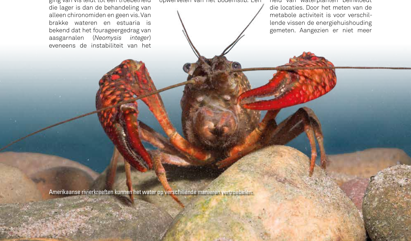
Amerikaanse rivierkreeften kunnen het water op verschillende manieren vertroebelen.

aantal van de bovenstaande factoren kunnen (al dan niet met een slag om de arm) worden gekwantificeerd voor individuele meren. Daarvoor is wel informatie over oppervlakte, diepte, windwerking, benthivore visbiomassa, bootbewegingen en de dichtheid aan macrofauna nodig. Om het effect van deze factoren tegen elkaar af te zetten is het van belang om met een gelijke eenheid te rekenen. Voorgesteld wordt om hier een energiemaat voor te gebruiken, in dit geval de hoeveelheid energie die nodig is om een bepaalde hoeveelheid sediment, uitgedrukt in joule (J), op te wervelen. Op grond hiervan wordt het mogelijk te bepalen welke 'woeler' een significante bijdrage levert aan het opwervelen van bodemmateriaal en welke effectieve maatregelen kunnen worden genomen om dit effect tegen te gaan. In deze benadering kan bodemschuifspanning ( N/m^2 ) veroorzaakt door waterbeweging worden omgezet in joule (Nm), daarna te gaan over hoeveel oppervlak van de bodem de horizontale component van de golfbeweging over een bepaalde periode heengaat. Deze wordt ruimtelijk bepaald en alleen meegenomen als deze boven een kritische waarde uitkomt. Per meer is dit dus anders en afhankelijk van de locatie in het meer. De aanwezigheid van waterplanten beïnvloedt die locaties. Door het meten van de metabole activiteit is voor verschillende vissen de energiehuishouding gemeten. Aangezien er niet meer