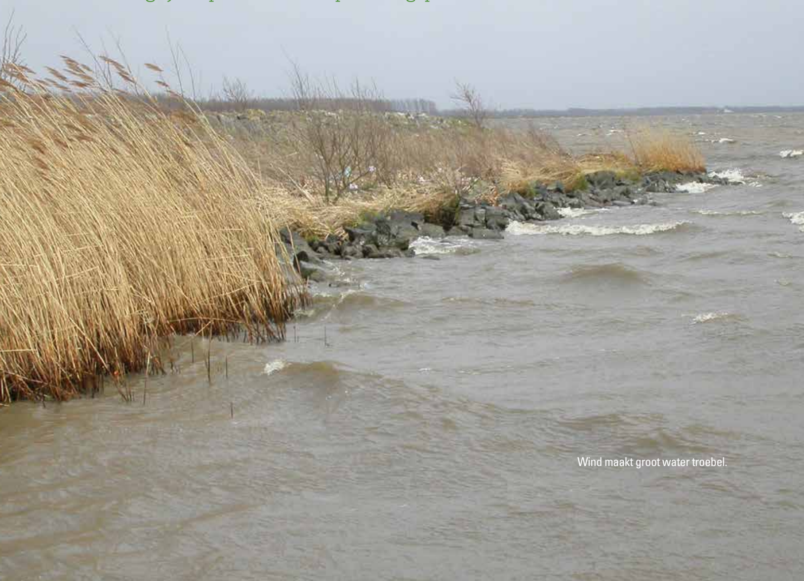
Wind maakt groot water troebel.

Veel ondiepe meren en plassen in Nederland zijn nog altijd te troebel. Hoewel algenbloei vaak als boosdoener wordt beschouwd, speelt de opwerveling van sediment ten gevolge van wind, stroming, (macro) fauna en menselijk gebruik ook een belangrijke rol. Recent onderzoek probeert duidelijkheid te verschaffen in de relatieve bijdrage van de belangrijke spelers in het opwoelingsproces.