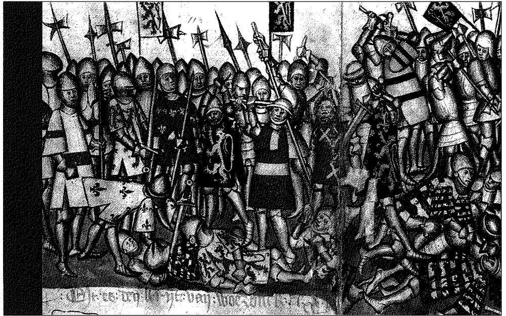
De Slag bij Woeringen in 1288, die de Brabantse hertog Jan I tevens de titel van hertog van Limburg en de bijbehorende gebieden opleverde. Illustratie uit een vijftiende-eeuws handschrift van de 'Brabantse Yeesten', oorspronkelijk geschreven door de Antwerpse schepenkerk Jan van Boendale (coll. Koninklijke Bibliotheek, Brussel).