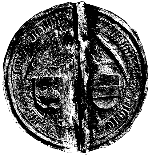
Afb. 5. Gebroken zegelstempel van de stad Vlissingen (vijftiende eeuw), onbruikbaar gemaakt door het dubbel te slaan. ZA, KZGW, collectie zegels en stempels nr. 91.

schaarambacht lijkt een eigen rijkje te vormen, met een eigen minikanselarij en als schrijver de plaatselijke parochiegeestelijke, door de ambachtsheren gekozen uit hun eigen vertrouwelingen of misschien wel hun eigen familie.