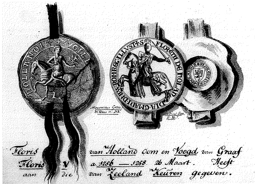
Afb. 3. Afbeelding van het zegel en contrazegel van Floris de Voogd. ZA KZGW, Zel. Ill. III-693.

ving op de oudste zoon, met een vergoeding voor zijn broers, behalve, zo luidt een artikel, wanneer de vader een andere verdeling heeft gemaakt en deze in een oorkonde op naam van zeven gezworenen heeft laten vastleggen. De bepaling dat die verdeling bij oorkonde moest zijn vastgelegd, had ongetwijfeld ten doel toekomstige familievetes te voorkomen. Hoe diep de schriftelijke cultuur in Zeeland in de kring van ambachtsheren dan al is doorgedrongen, blijkt uit het feit dat de toepassing van het schrift wordt geacht mogelijke problemen afdoende op te lossen. De twee andere artikelen lijken de werkelijke, dan al deels schriftelijke rechtspraktijk in Zeeland te weerspiegelen. Zo bevat het ene artikel een regeling voor het geval twee oorkonden elkaar tegenspreken. Vastgesteld wordt dat de oudste dan van kracht blijft, behalve in het geval waarin kan worden bewezen dat deze in strijd met de billijkheid is uitgevaardigd. Ook het derde artikel is aan schriftelijke bewijsvoering gewijd. Het bepaalt de straf — verlies van lijf en goed — op het vervalsen van oorkonden en zegels. Hoezeer dit artikel stoelt op de praktijk, bewijst het tweede lid, waarin de wijze van vervalsing wordt uitgelegd: het namaken van een zegel met het doel daarmee een oorkonde te bekrachtigen.