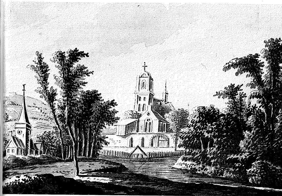
Ab. 1. Achttiende-eeuwse tekening van het klooster Jeruzalem bij Biezelinghe anno 1546. ZA, KZGW, Zel. III. II-1558.