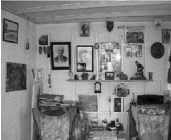
Voor de bewoonster van het huis waar deze foto is genomen, staat gezelligheid los van de inrichting

omhoog, en vitrages hoeven van haar ook niet zo nodig: “Ik wil als het even niet hoeft geen vitrages, want dat vind ik te vol. Ik wil licht en ruimte.” Een ander zegt de gordijnen weleens voor de warmte dicht te doen, ‘maar nooit tegen de inkijk’ . En een derde informant licht toe: “De gordijnen zijn voor de sier en om het geluid te absorberen” .