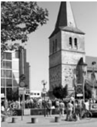
De Pancratiuskerk in Heerlen

Aan de kinderen werden 30 zinnen met plaatjes voorgelegd. De onderzoeker toonde eerst een plaatje van een jongen met een groene bloem en zei dan de volgende zin die het kind moest afmaken: Deze jongen tekent de groene bloem en dit meisje tekent ... Vervolgens liet de onderzoeker een plaatje zien met een meisje en een gele boot. Het kind moet dan zeggen: de gele boot .