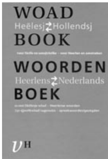
Omslag van het Heerlens dialect-Nederlands woordenboek

maar het lidwoord de; het komt nog helemaal niet voor: