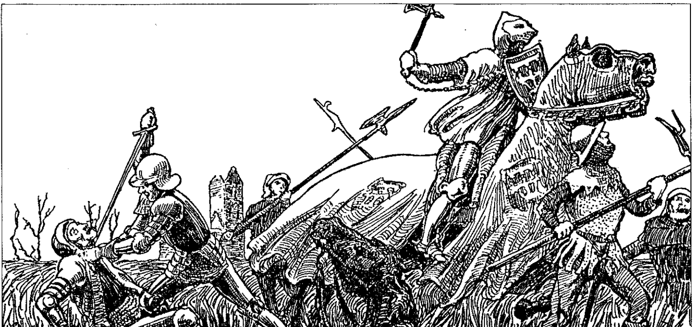
Vete tussen Schieringers en Vetkopers naar een voorstelling van R. Dozy uit 1925

Door dit alles zou het onjuist zijn te stellen dat in de vetemaatschappij recht ontbrak. Recht bestond zeker, maar het werd niet ondersteund door een geweldsmonopolie van de overheid. Het beste kan men de toestand vergelijken met het huidige internationale recht, dat vooral normatief is, maar moeilijk afdwingbaar; men denke slechts aan het negeren door Israel en Irak van de resoluties van de VN. De positie van de vetepartijen benadert, zo gezien, die van de huidige nationale staten. Pas in