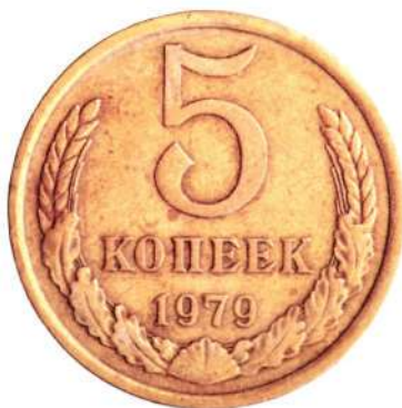
MUNTSTUK Vijf kopeke

SINDS DE MIDDELEEUWEN NAMEN DE RUSSEN VEEL MEER WOORDEN OVER UIT HET NEDERLANDS DAN ANDERSOM. BALANS VAN DE TAALUITWISSELING