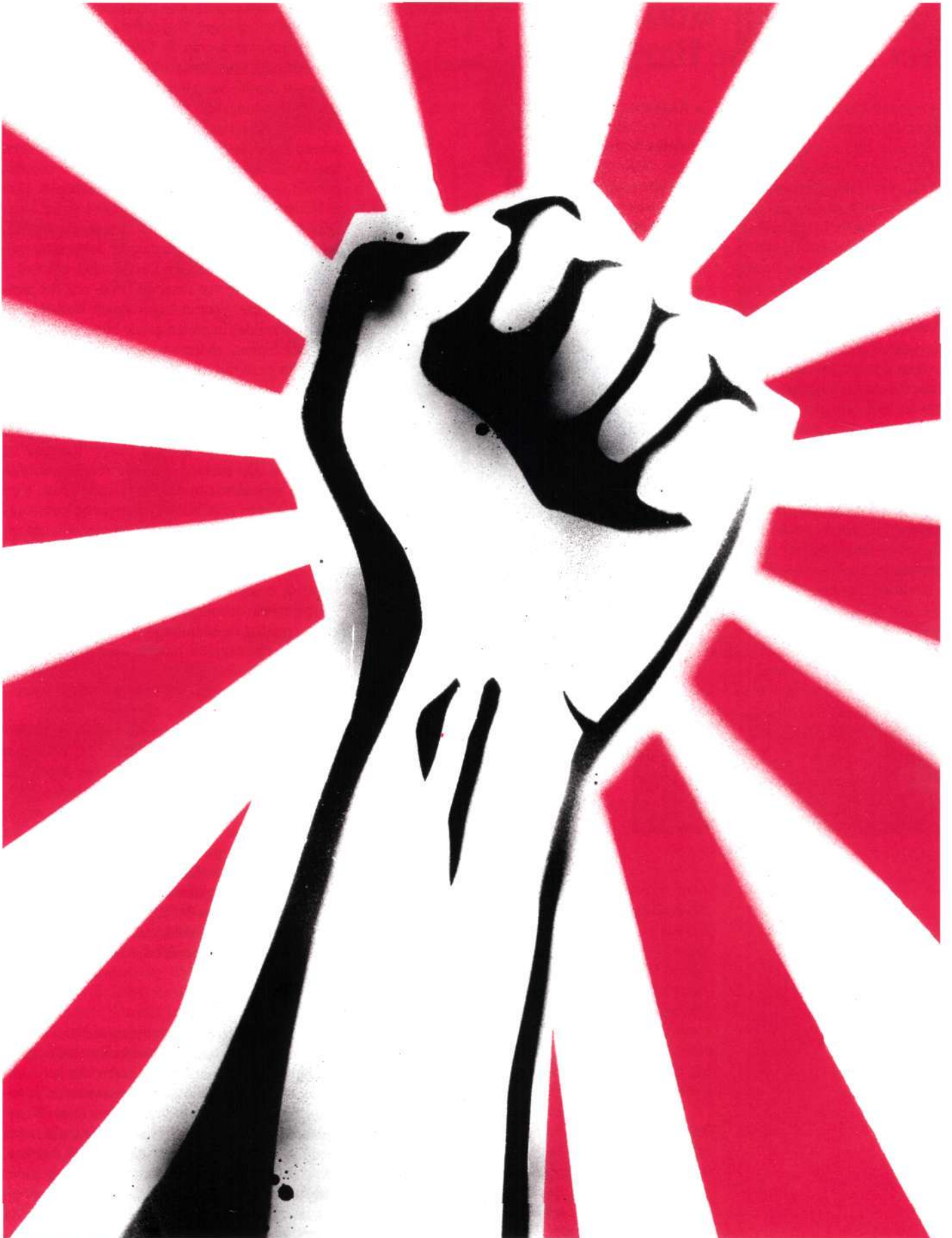
SOVJET-POSTER Tijdens het communisme werden zelfstandige boeren aangeduid met een benaming uit de tsaristische tijd: koelak, letterlijk 'vuist'