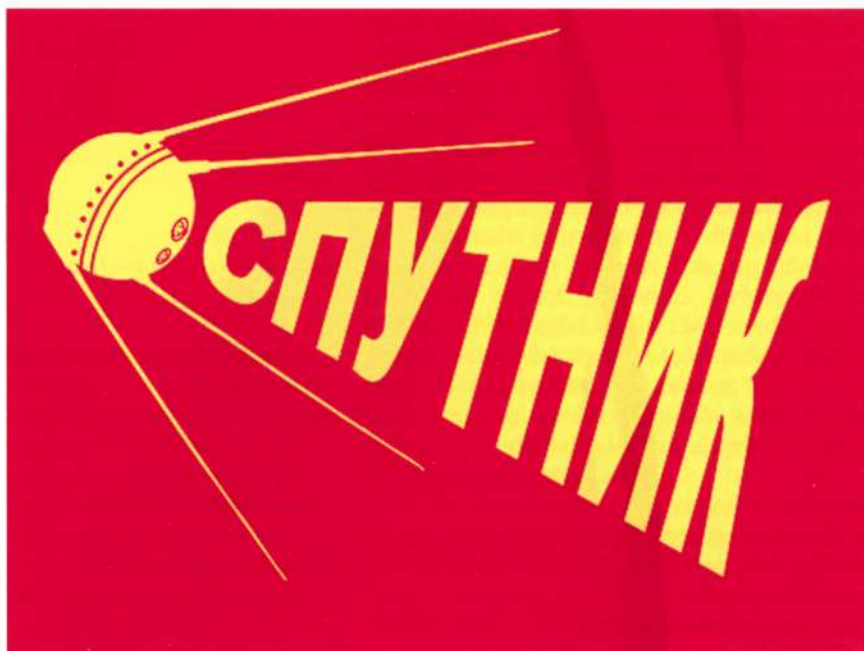
RUIMTEPIONIERS Met de Spoetnik brachten de Sovjets de eerste satelliet in de ruimte

De ideeën van sociale vernieuwing die eind negentiende en begin twintigste eeuw in Rusland opgang maakten en leidden tot het invoeren van het communisme in 1917, hebben veel leenwoorden opgeleverd in het Nederlands en in andere talen. Woorden als agitprop , bolsjewiek , datsja (buitenhuis van partijfunctionaris), doema , goelag , koelak , kolchoz , komsomol , mensjewiek , nomenklatoera , politbureau , samizdat , sovchoz en trotskist . Sport en ruimtevaart waren gebieden waarop de Sovjet-Unie internationaal prestige verwierf. Dit leverde leenwoorden op als kosmonaut en spoetnik . Door de