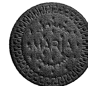
Het Mariakaakje van Verkade

Eind jaren '40 bezochten de Amerikaanse gezanten Averell Harriman en Paul Hoffman Nederland, in het kader van het Marshallplan. Zij zouden met onder andere minister-president Willem Drees praten over financiële steun vanuit Amerika voor de Nederlandse economie. De inwoners van