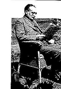
Willem Drees (1886-1988) De verzorgingsstaat