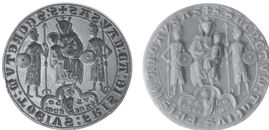
AFB. 4 Secretzegel met afdruk van de verenigde Friese landen. Maria met kind wordt terzijde gestaan door twee Friese krijgers. Uit: Tijdschrift voor Geschiedenis 123/2 (2010) 204.