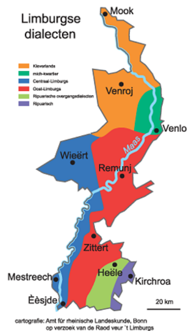
Kaart 1: Isoglossenkaart van Limburg

Ondertussen laat taalkundig onderzoek zien dat iedere afbakening van een dialect arbitrair is. Elk talig verschijnsel kan, afhankelijk van de grammaticale component, dus woordenschat (lexicon), uitspraak (fonologie) en zinsbouw (morfosyntaxis), een verschillende geografische distributie vertonen. Doordat die componenten elkaar niet overlappen, vloeien – wat wij talen en dialecten noemen – in een geografisch gebied als waaiers in variërende breedtes in elkaar over. Het is dus niet mogelijk om taalkundig vast te stellen waar het ene dialect begint en het andere ophoudt. Daardoor is het ook niet mogelijk om taalkundig een ‘taal’ of een ‘dialect’ te definiëren indien deze termen aan typologisch nauw verwante variëteiten refereren zoals aan het Nederlands, Duits, Fries of een Limburgs dialect. 7 Het