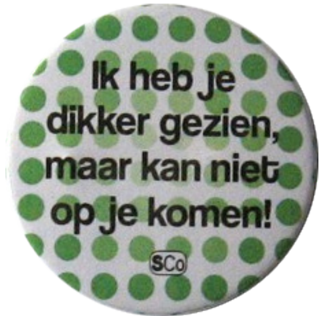
Illustratie 2: Heerlens Nederlands 58

De traditionele media als lokale dagbladen, televisie en radio vertolken meer het dominante nostalgische perspectief op dialecten als kwetsbaar cultureel erfgoed, als dragers van orale tradities en als markeerders van traditionele lokale identiteiten. 59 De talige praktijken in dit domein zijn er vooral op gericht om het dialect dat als ‘authentiek’ en ‘zuiver’ ervaren wordt, te behouden door codificatie. Het is hier dat men ijvert voor woordenboeken, grammatica’s, dictees en een uniforme spelling van het dialect. 60 Tegelijkertijd bieden nieuwe elektronische media aan gebruikers tal van nieuwe vormen van sociale interactie en culturele en talige productie en consumptie. Dit domein is een ‘plek’ waar jongeren aan een lokale