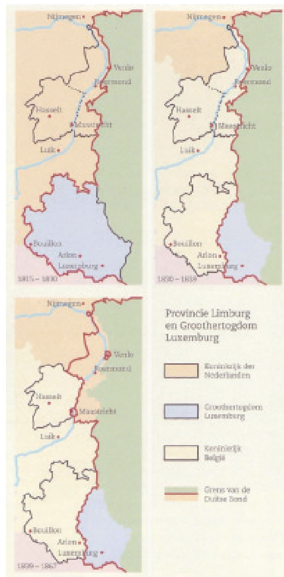
Kaart 3: Limburg in verhouding tot de Duitse Bond 1839-1867. Uitzondering: vestingen van Maasbracht en Venlo 40

Bovendien is identificatie met Limburg pas vrij recent mogelijk en staan daartoe vele talige bronnen ter beschikking. De territoriale grenzen van de huidige provincie zijn ontstaan tussen 1815 en 1839. 39 Voor 1815 bestond de naam Limburg nog niet voor dit gebied en voor 1839 bestond de provincie Limburg nog niet in de huidige afbakening. Dit weerlegt haarscherp het idee dat zoiets als een Limburgse identiteit al vanaf oudsher bestaan heeft. In de negentiende eeuw identificeerden men zich bovendien niet met Limburg maar wel met eigen dorp of stad. 41