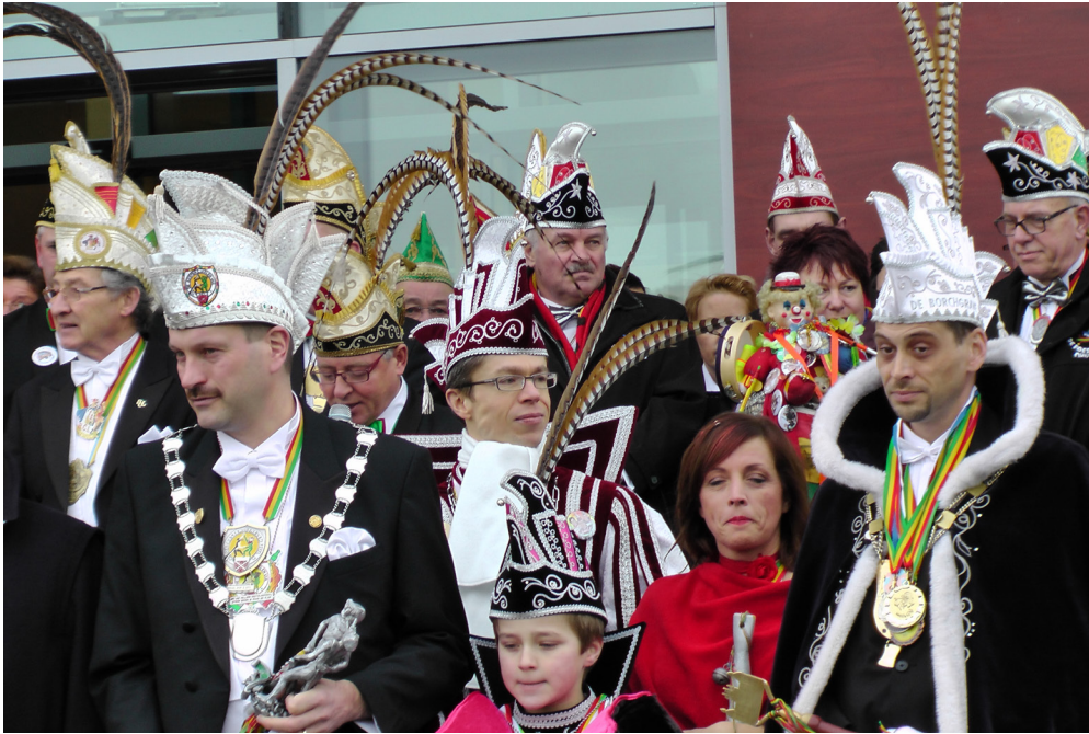
Wachten op de Heerlense “Blauwe Schuit” in Echt (14 Februari 2012)

sociale geografie in de tweede helft van de twintigste eeuw. Hierin is het idee van de ‘traditionele regio’ vervangen door dat van de ‘vrijwillige regio’. In dit perspectief is een ‘plek’ het resultaat van de diverse keuzes die verschillende groepen mensen maken hoe zij de wereld zoals zij die beleven indelen. Mensen creëren een fysieke ruimte tot een ‘plek’ als betekenisvolle context van menselijke handelen. Zij identificeren zich met een plek zodanig dat het voor hen betekenis heeft, vertrouwd is en transparant in vergelijking met een ‘plek’ elders. 18 Vanuit deze context impliceert een plek creëren dat groepen mensen op een bepaalde wijze spreken, dat zij op een bepaalde wijze aan gebeurtenissen deelnemen en rituelen uitvoeren.