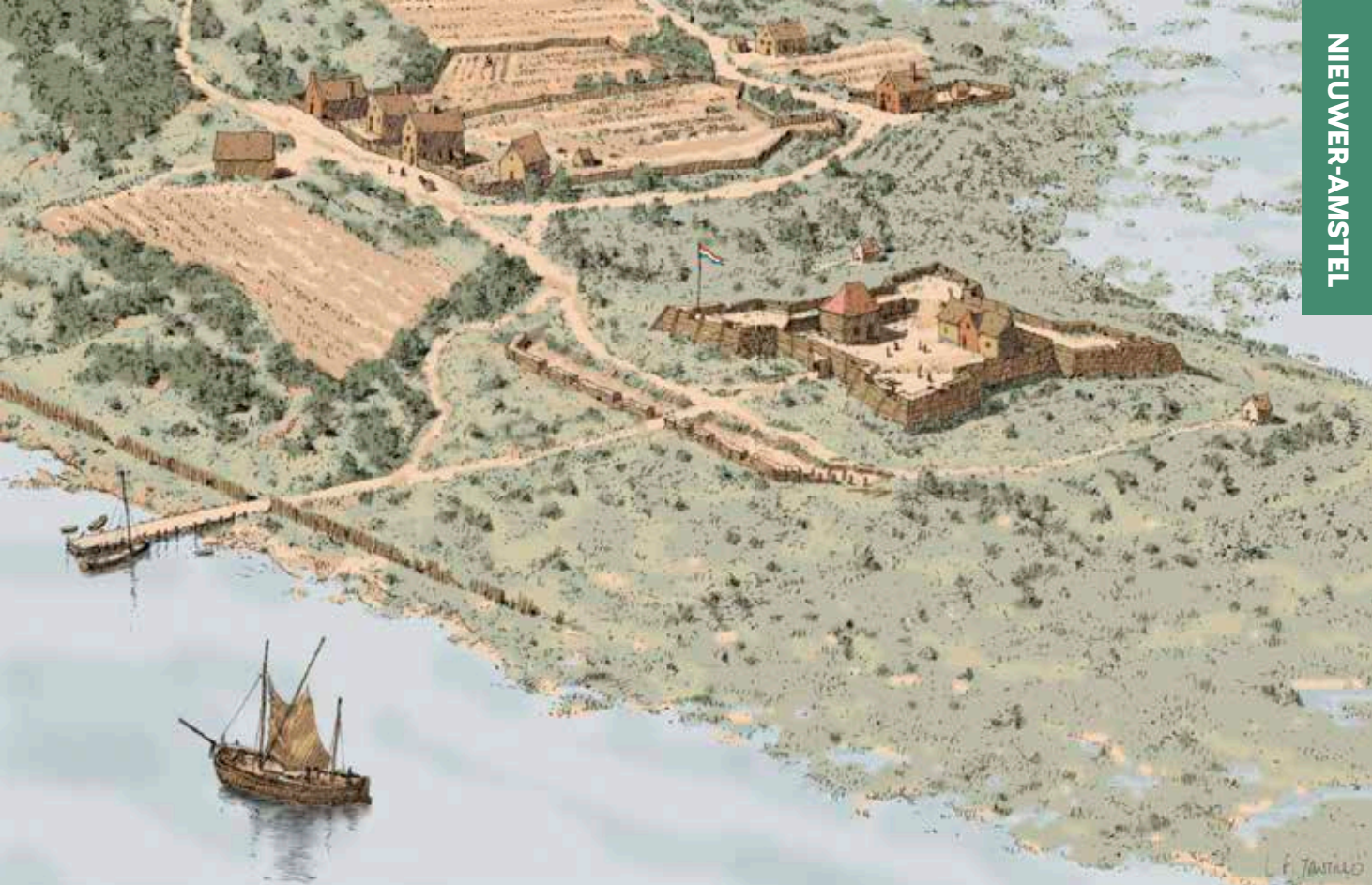
▲ Nieuwer-Amstel (eerder Fort Casimir), Zuidrivier, ca. 1657. Tekening Len Tantillo, 2010. LEN TANTILLO

en bovendien winstgevend. Ieder lid werd geacht nijver te werken, “alsoo wij met geen heerschappijje ofte knechtische slavernijje onze compagnie willen belasten”. Met andere woorden, van slavernij kon geen sprake zijn – heel wat anders dan gebruikelijk in Nieuw-Nederland.