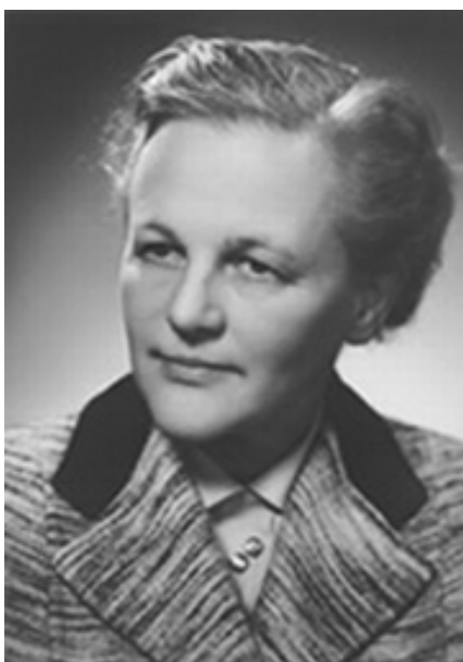
Hilda Verwey-Jonker (PvdA)

De betekenis van de Pacificatie voor de emancipatie van vrouwen ging dus verder dan het bekleden van vertegenwoordigende functies door vrouwen. Op lokaal niveau zetten vrouwen zich in voor de verbetering van de positie van hun seksegenoten. Zo werd in de gemeenteraad een verschil gemaakt door zich sterk te maken voor specifiek vrouwelijke belangen, zoals betere kraamzorg en nijverheidsonderwijs voor meisjes. Ook kan hier iets substantieels worden gezegd over de inbreng van vrouwelijke parlementariërs op landelijk niveau. Er zijn belangwekkende casussen uit de jaren vijftig van de twintigste eeuw die duidelijk maken dat zij hun positie hebben ingezet voor de emancipatie van vrouwen, in het bijzonder gehuwde vrouwen.