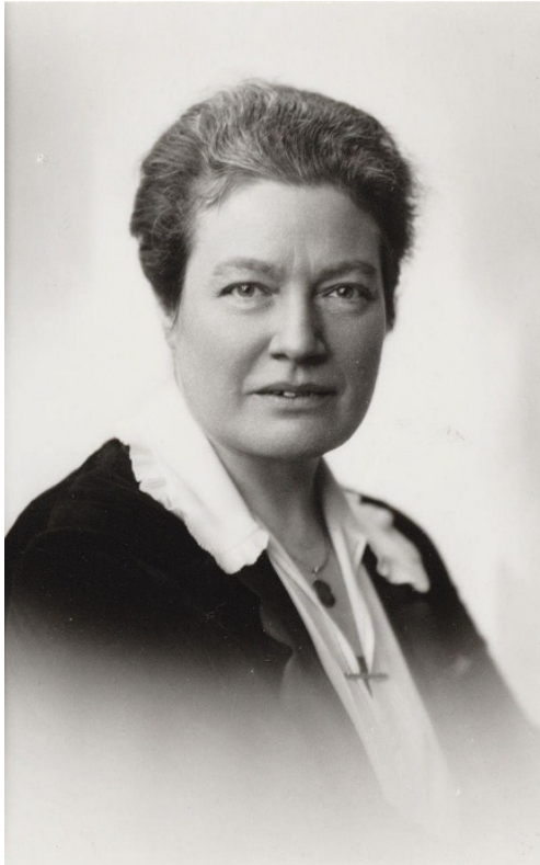
Frida Katz Christelijk Historische Unie