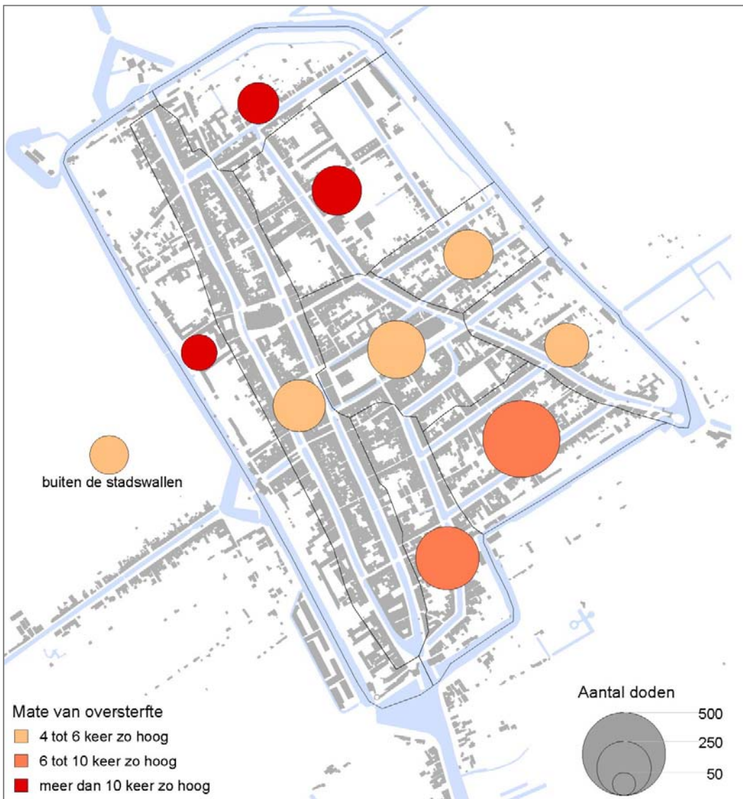
Figuur 3. Sterfte en mate van oversterfte* in Delft in de tweede helft van 1624

* Oversterfte = sterfte in 2de helft 1624 / sterfte in 2de helft 1623