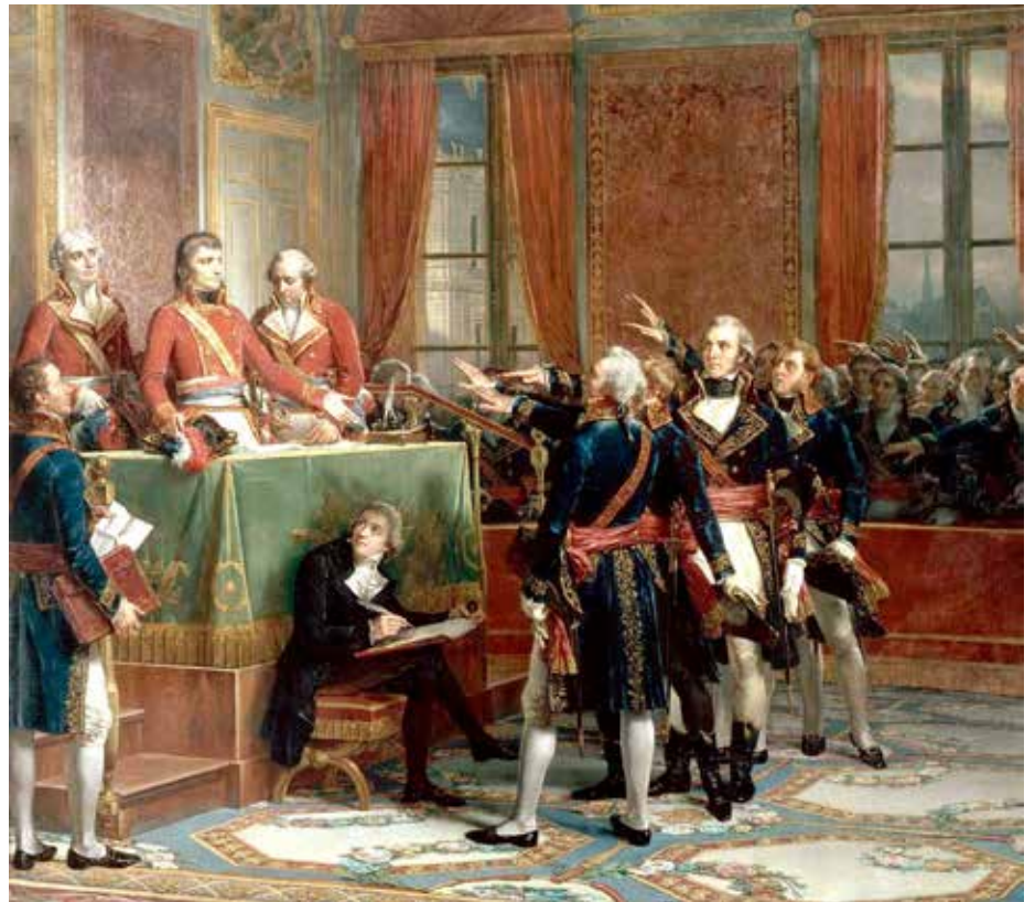
De installatie van Napoleon als consul in 1799, door Auguste Codier, 1856 (collectie Conseil d'État, Paris).

Een cruciaal moment in deze ontwikkeling is de kroning van Napoleon tot keizer in 1804. Twaalf jaar eerder zou dit ondenkbaar zijn geweest. Toen immers, in 1792, maakten de revolutionaire machthebbers Frankrijk tot een republiek en guillotineerden zij kort daarna zelfs de afgezette koning Lodewijk XVI. Na zeven jaren van politieke strijd, sociale onrust, militaire dreiging en financiële chaos waren de Franse elites echter opnieuw bereid de macht toe te vertrouwen aan een alleenheerser. Door één sterke man aan het hoofd van de Republiek te plaatsen, hoopten zij al het goede te behouden dat sinds 1789 ten koste van vele offers was bevochten. De succesrijke generaal Napoleon Bona-