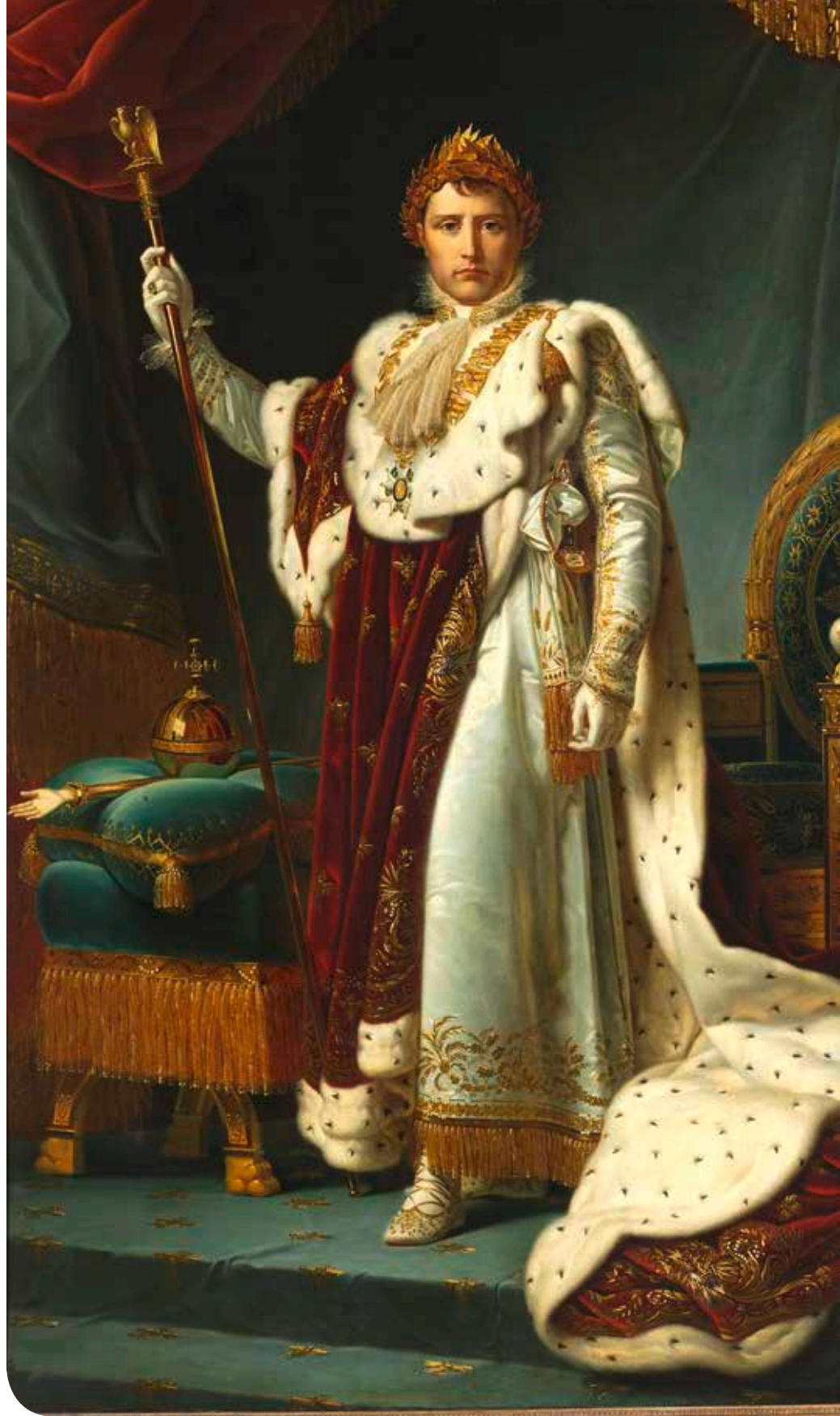
Napoleon in keizersmantel, ca. 1805-1815; (atelier van) François-Pascal Simon baron Gérard. Rijksmuseum Amsterdam.

Na 1802 nam het hofpersoneel sterk in aantal toe. Napoleon verdeelde het nu