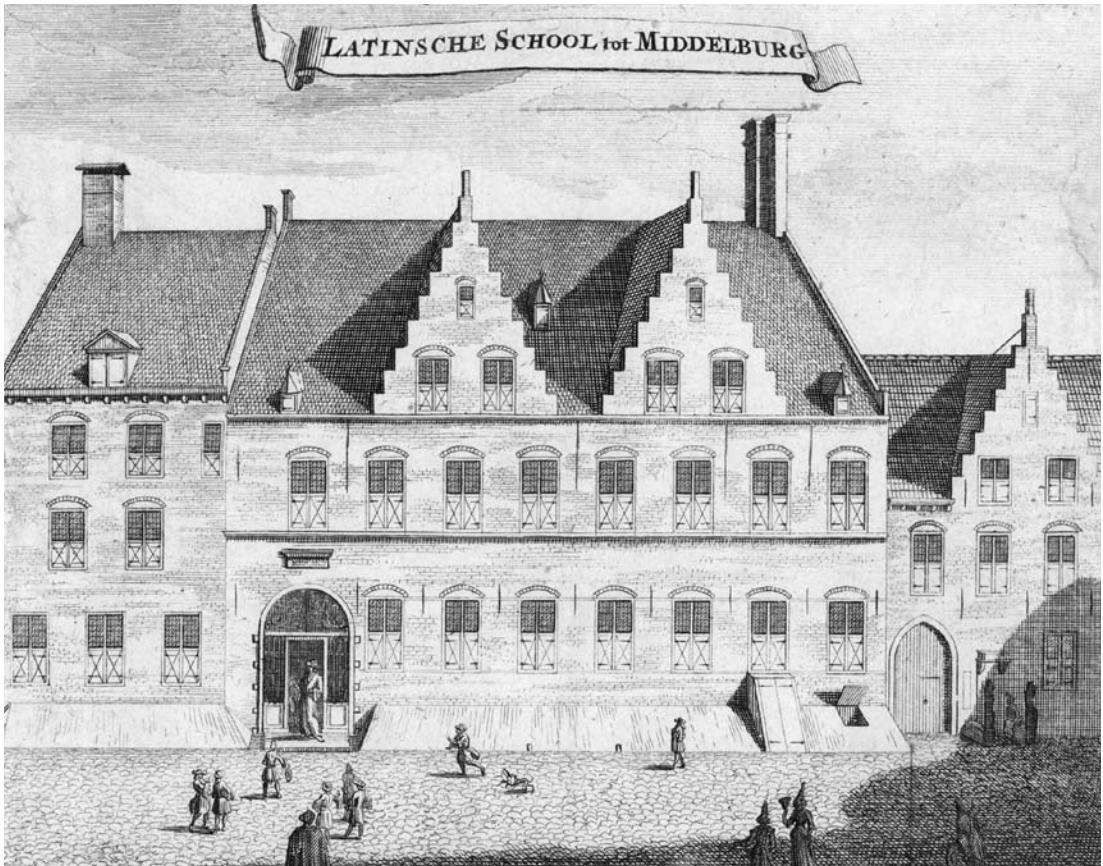
De voorgevel van de Latijnse School aan de Latijnse Schoolstraat te Middelburg. Uit: M. Smallegange, Nieuwe Chronijk van Zeeland (1696). (ZA, Zel. III. II nr. 678)

stand, die eveneens plechtig werd geopend, zij het minder uitbundig dan eerder in Leiden het geval was geweest. In diezelfde roerige jaren van de opstand tegen de Spaanse landsheer volgde ook de oprichting van enkele “Illustre Scholen”. 6 Zo’n Illustre School of Athenaeum was een instelling voor hoger onderwijs die alleen een academische basisopleiding mocht verzorgen, maar geen promotierechten bezat. (Zo gezien is de huidige Roosevelt Academy dus een eigentijdse Illustre School.)