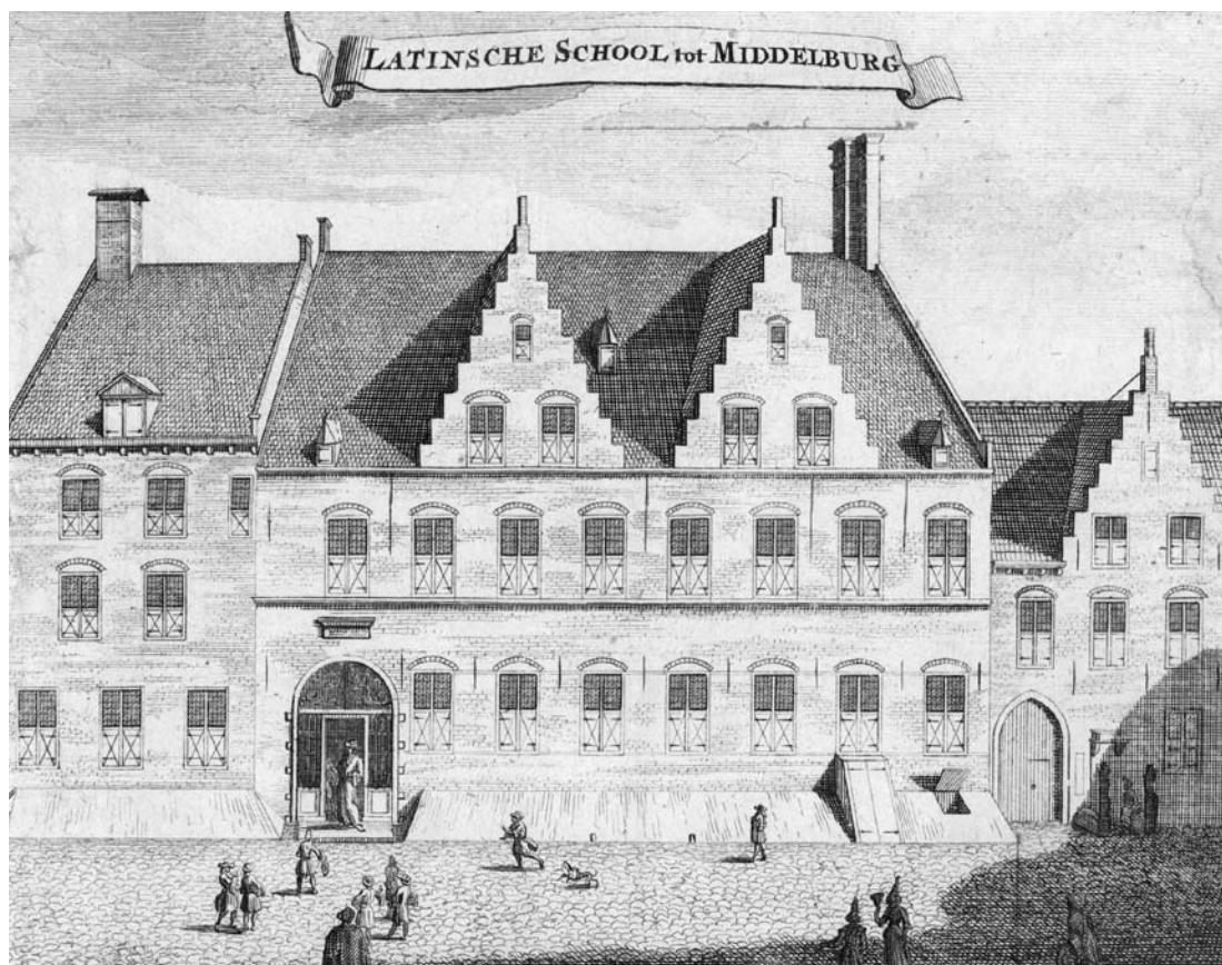
De voorgevel van de Latijnse School aan de Latijnse Schoolstraat te Middelburg. Uit: M. Smallegange, Nieuwe Chronijk van Zeeland (1696). (ZA, Zel. III. II nr. 678)

stand, die eveneens plechtig werd geopend, zij het minder uitbundig dan eerder in Leiden het geval was geweest. In diezelfde roerige jaren van de opstand tegen de Spaanse landsheer volgde ook de oprichting van enkele “Illustre Scholen”. 6 Zo’n Illustre School of Athenaeum was een instelling voor hoger onderwijs die alleen een academische basisopleiding mocht verzorgen, maar geen promotierechten bezat. (Zo gezien is de huidige Roosevelt Academy dus een eigentijdse Illustre School.)