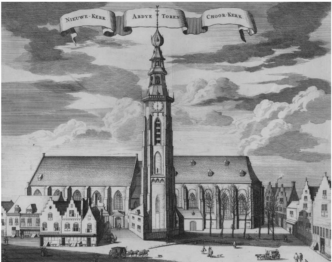
In het laatste decennium van de zestiende eeuw werden er in de Nieuwe Kerk te Middelburg zogenaamde preacademische lezingen gehouden. Gezicht op de Nieuwe Kerk, Abdijs-toren en Koorkerk te Middelburg, Uit: M. Smallegange, Nieuwe Chronijk van Zeeland (1696). (ZA, Zel. III. II nr. 546)

fungeerde daarmee in feite als stedelijk lector in de filosofie. Op dat moment werd de Latijnse School te Middelburg geleid door rector Jacobus Gruterus (?-1607), de zoon van een Zierikzeese predikant. Met hem bezat de stad al een humanistisch geleerde van enige naam. 14 Ten minste vanaf 1593 hebben zowel Gruterus als Murdison in Middelburg daadwerkelijk publieke colleges gegeven, de eerstgenoemde in de geschiedenis en de tweede in de filosofie. Gruterus’ neef Reynier maakt hiervan melding in een brief, waarin hij tevens bericht dat deze colleges zowel door studenten als door weetgierige kooplieden werden gevolgd. 15 Tegen de eeuwwisseling kregen de beide docenten versterking van de lokale predikant Johannes Isenbach (ook wel Hitzenbach genaamd), die eveneens publieke lessen ging verzorgen, ditmaal in de theologie. 16 Deze publieke preacademische colleges werden gehouden in de