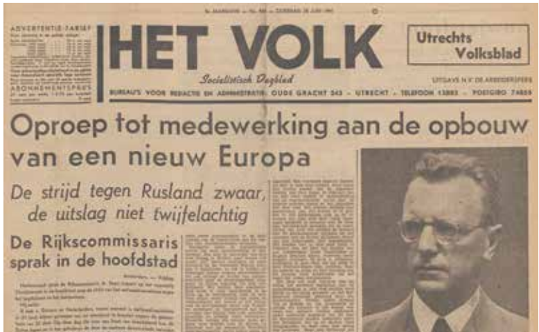
Het Volk, 28 juni 1941

In de twintigste eeuw ontwikkelde zich een moderne levensstijl. Die kwam tot uitdrukking in de stedelijke cultuur, snelheid, massificatie, nieuwe media en populaire cultuur. De meeste