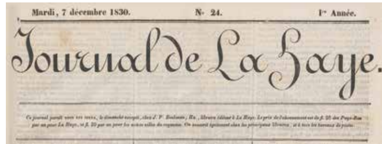
Journal de la Haye, 7 december 1830

De Franse machthebbers voerden in 1812 de dagbladzegelbelasting in, op basis van het