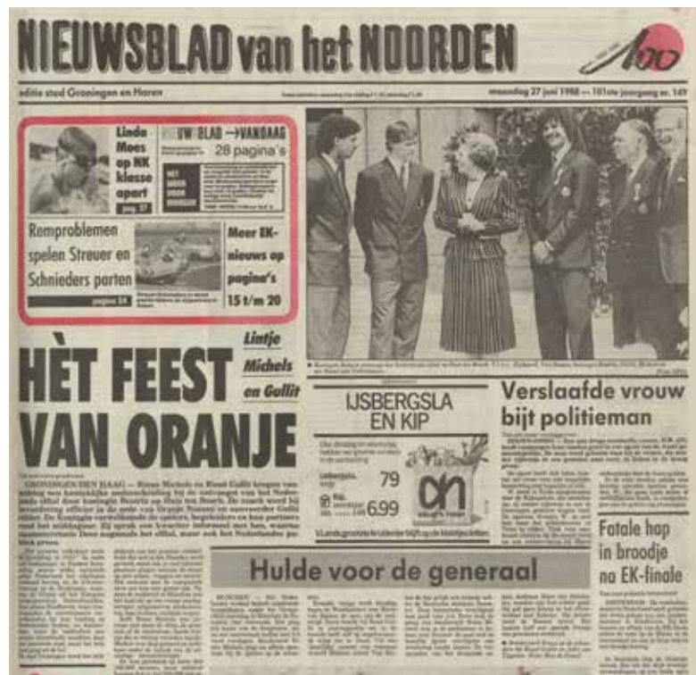
Nieuwsblad van het Noorden, 27 juni 1988

De pers bevrijdt zich van de traditionele banden met de zuielen. De houding ten opzichte van kerkelijke, wereldlijke en koninklijke autoriteiten wordt kritischer. In de nieuwsvoorziening komt meer openheid en openbaarheid. Er treedt een schaalvergroting op bij de krantenuitgeverijen; de kleine afzonderlijke uitgeverijen worden overgenomen door grote organisaties.