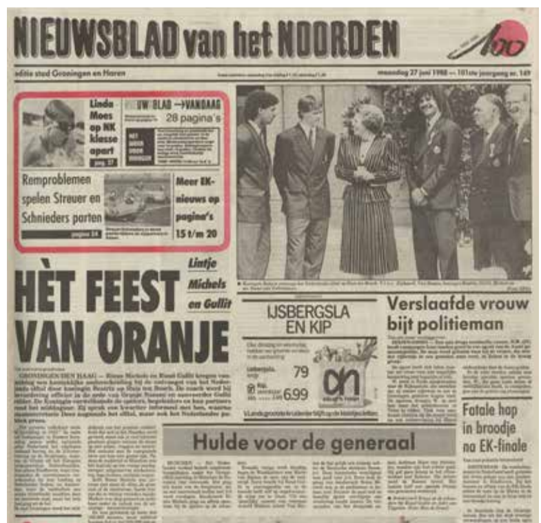
Nieuwsblad van het Noorden, 27 juni 1988

De pers bevrijdt zich van de traditionele banden met de zuielen. De houding ten opzichte van kerkelijke, wereldlijke en koninklijke autoriteiten wordt kritischer. In de nieuwsvoorziening komt meer openheid en openbaarheid. Er treedt een schaalvergroting op bij de krantenuitgeverijen; de kleine afzonderlijke uitgeverijen worden overgenomen door grote organisaties.