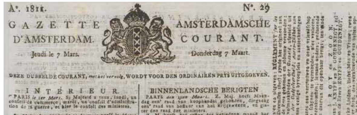
Gazette d'Amsterdam, 7 maart 1811

De oudste krant van Nederland die bewaard is gebleven is de Courante uyt Italien, Duytslandt, &c. van (ca.) 14 juni 1618, uitgegeven in Amsterdam door Casper van Hiltten. Minder dan een jaar later had Amsterdam al een tweede krant, aanvankelijk naamloos maar in 1629 Tydinghe uyt verscheyde quartieren gedoopt waarvan het oudste bewaarde nummer dateert van (ca.) 10 februari 1619.